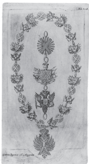
Рис. 3. Цепь ордена Св. апостола Андрея Первозванного. 1730-е гг. Гравюра. БАН

В елизаветинское время по царскому заказу ордена изготавливали такие ювелиры, как, например, Якоб Дублон, возглавивший с 1743 г. придворную мастерскую, и Себастьян Штульбергер. В 1742 г., помимо создания Малой короны для императрицы, Якоб Дублон сделал две короны к ордену Св. апостола Андрея Первозванного и один герб с короной к этому же ордену. В 1744 г. орден Св. Александра Невского, «в котором 100 бриллиантов»,