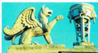
Зилант и Белый Барс на фасаде здания музея