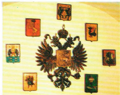
Фрагмент интерьера кафе "Трактир на Гоголя"