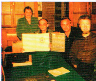
В библиотеке Казанского университета