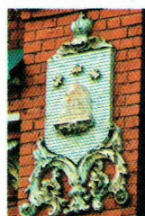
Железнодорожный вокзал в Казани и геральдические барельефы на нем.