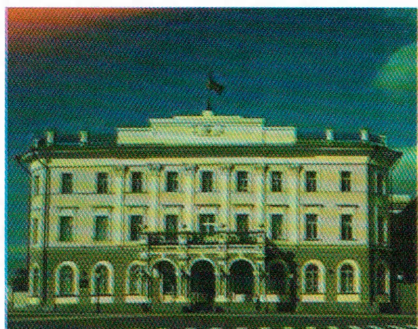
Администрация города Казани