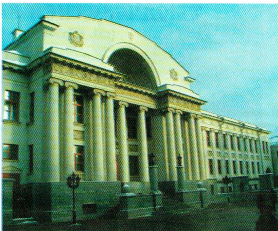
Здание Госбанка с гербами России, Татарстана и Казани