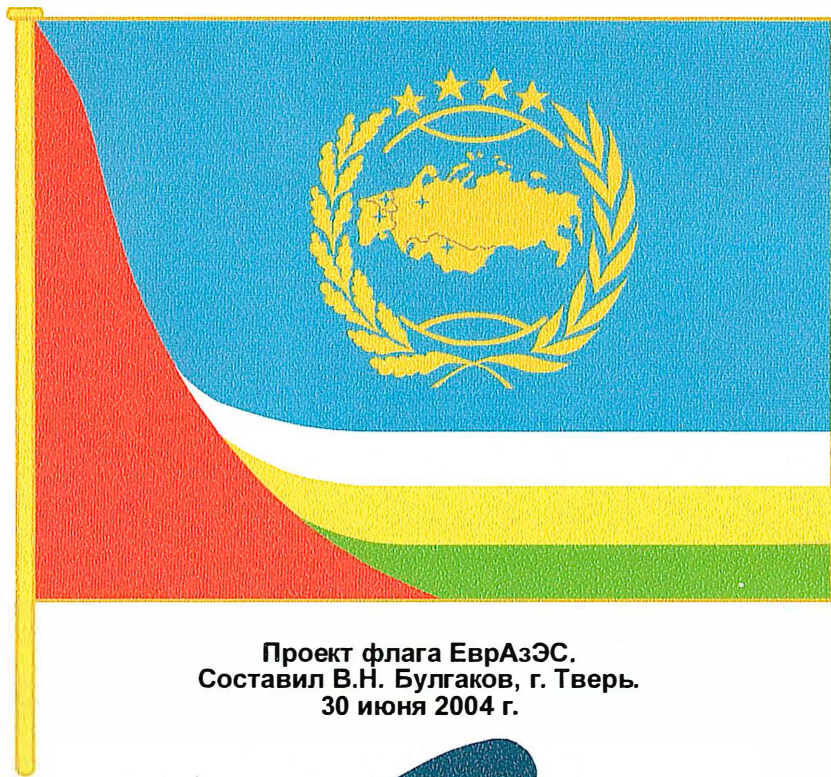
Проект флага ЕврАзЭС. Составил В.Н. Булгаков, г. Тверь. 30 июня 2004 г.