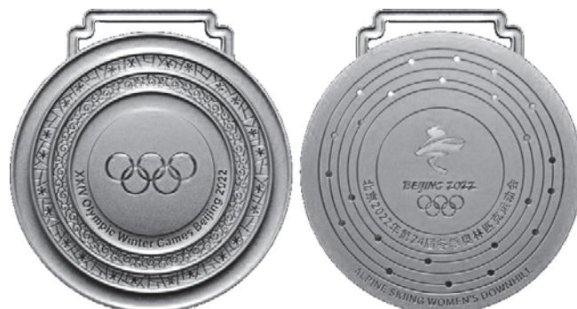
Рис. 1. Дизайн золотых медалей XXIV Зимних Олимпийских игр в Пекине, 2022 г. Аверс и реверс.

Исторически сложилась Олимпийская система призов победителям: золотая, серебряная и бронзовая медали (на рис. 1 – пример дизайна медалей последних, прошедших в 2022 г., зимних Олимпийских игр в Пекине).