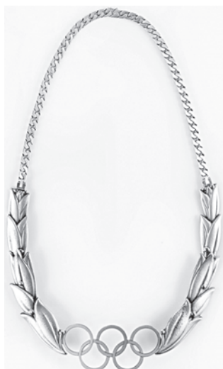
Рис. 3. Олимпийский орден.