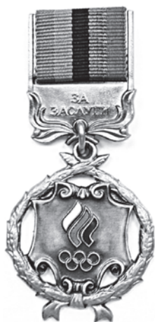
Рис. 4. Почетный знак ОКР «За заслуги в развитии олимпийского движения в России»