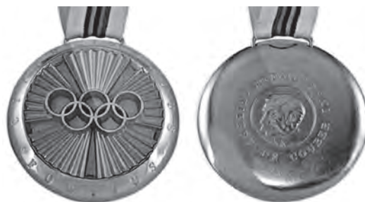
Рис. 6. Медаль Пьера де Кубертена.

Есть свои награды и у национального Олимпийского комитета России (ОКР; пример на рис. 4).