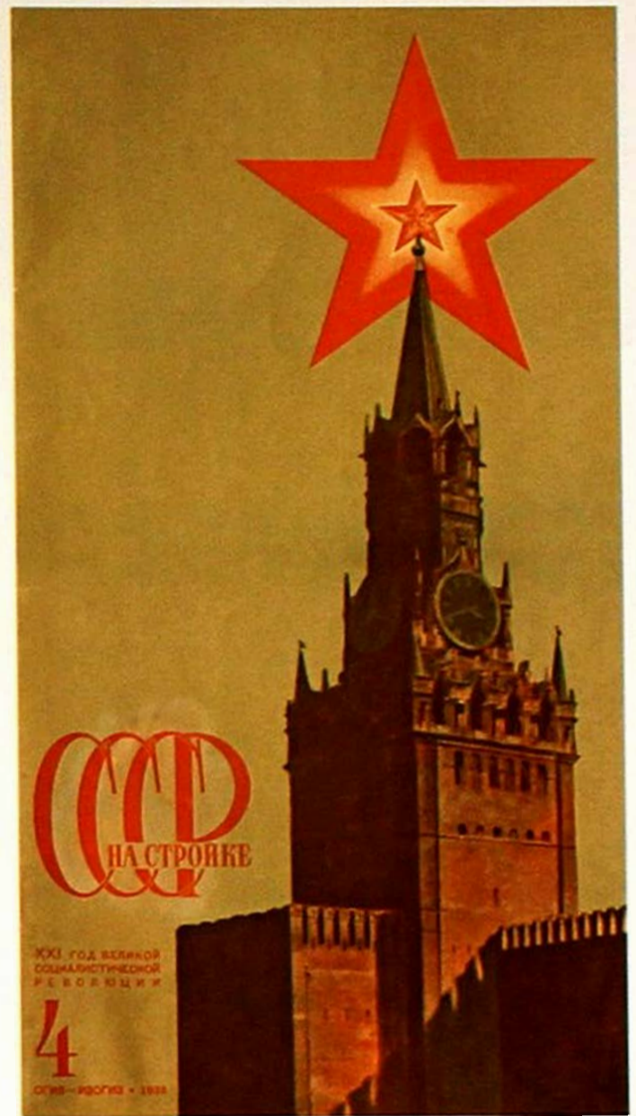
Вверху: звезды на башнях Кремля. Внизу: советские награды, в которых основой графического изображения является звезда

В 1937 г. прежние звезды на кремлевских башнях заменили светящимися изнутри, после войны их реставрировали — нержавеющую сталь заменили листовой позолоченной медью. В 1945—1946 гг. некоторые из них были восстановлены и реконструированы. На их изготовление пошло трехслойное рубиновое стекло.