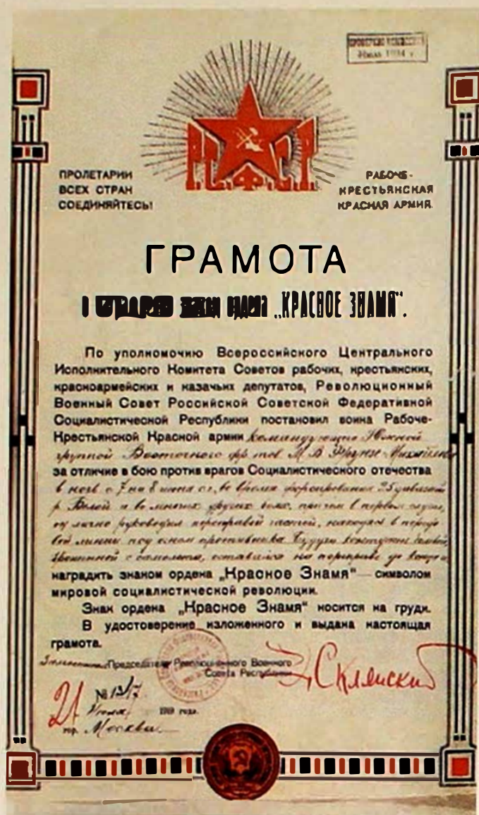
Звезда — военный и политический символ новой страны

теперь плуг был заменен на серп (приказ РВСР №953 от 13 апреля 1922 г.), поскольку серп также являлся символом, обозначающим крестьянский труд.