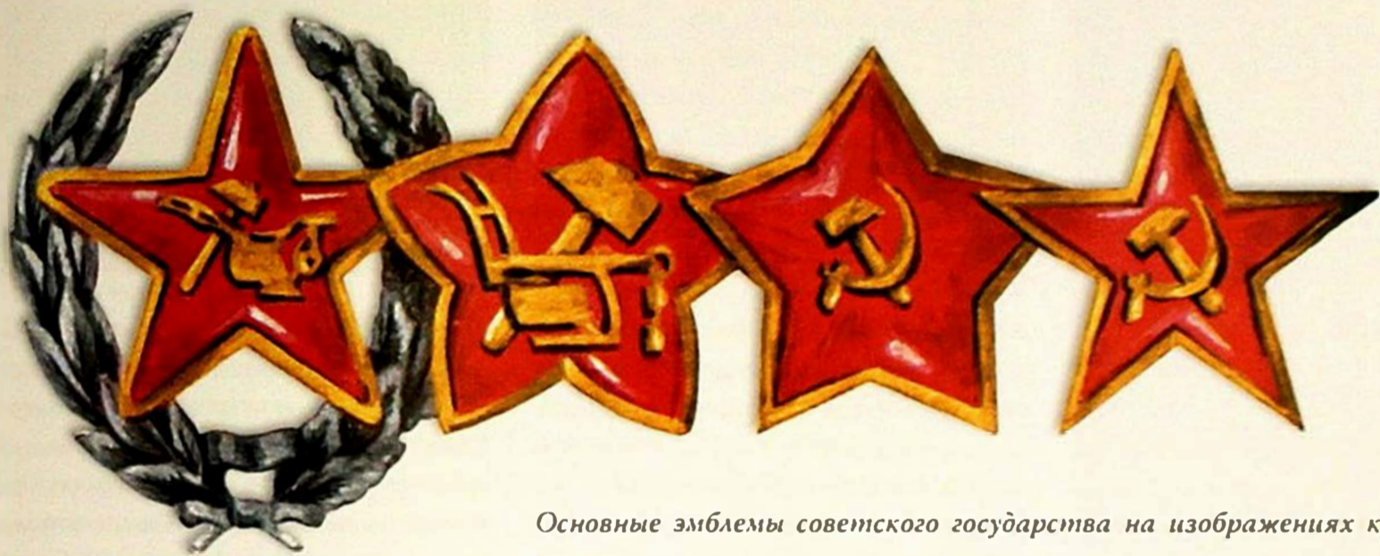
Основные эмблемы советского государства на изображениях красной звезды