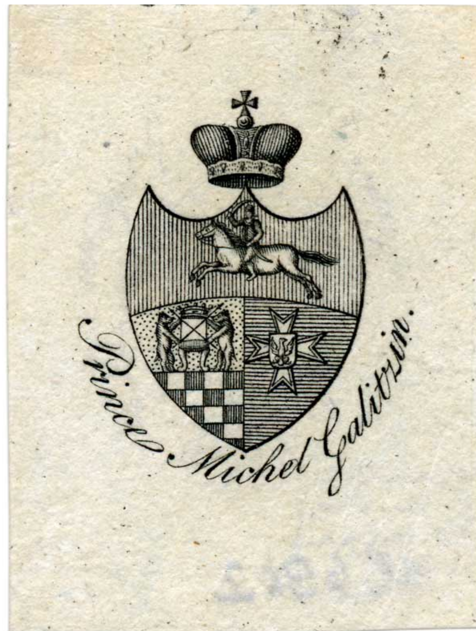
Экслибрис князя Михаила Николаевича Голицына (1796–1863). Вторая четверть XIX в. Офорт. 54x40, 35x29. Коллекция П.Д. Эттингера из собрания ГМИИ им. А.С. Пушкина. Инв. № ГЭ-6362.

В заключение заметим, что случай с рассматриваемым экслибрисом может служить дополнительным аргументом в пользу того, что исторический книжный знак часто бывает невозможно точно атрибутировать в отрыве от изданий, на которые они были нанесены. Этот тезис отстаивал и ныне покойный В.В. Лобурев 8 , а примером эффективности такого подхода могут служить работы П.А. Дружинина. 9