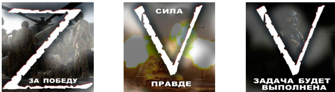
Рисунок 68 – Значение символов Z и V

Ряд российских историков обоснованно объясняют смысл Z и V их исконным русским значением. Так, глава совета Общероссийского общественного движения «Клубы Исторической Реконструкции России» историк Алексей Новиков заявил, что буквы Z и V, которые российские военнослужащие наносят на технику, используемую в спецоперации на Украине, присутствовали в древнеславянском алфавите и не имеют отношения к западному миру (рисунок 69).