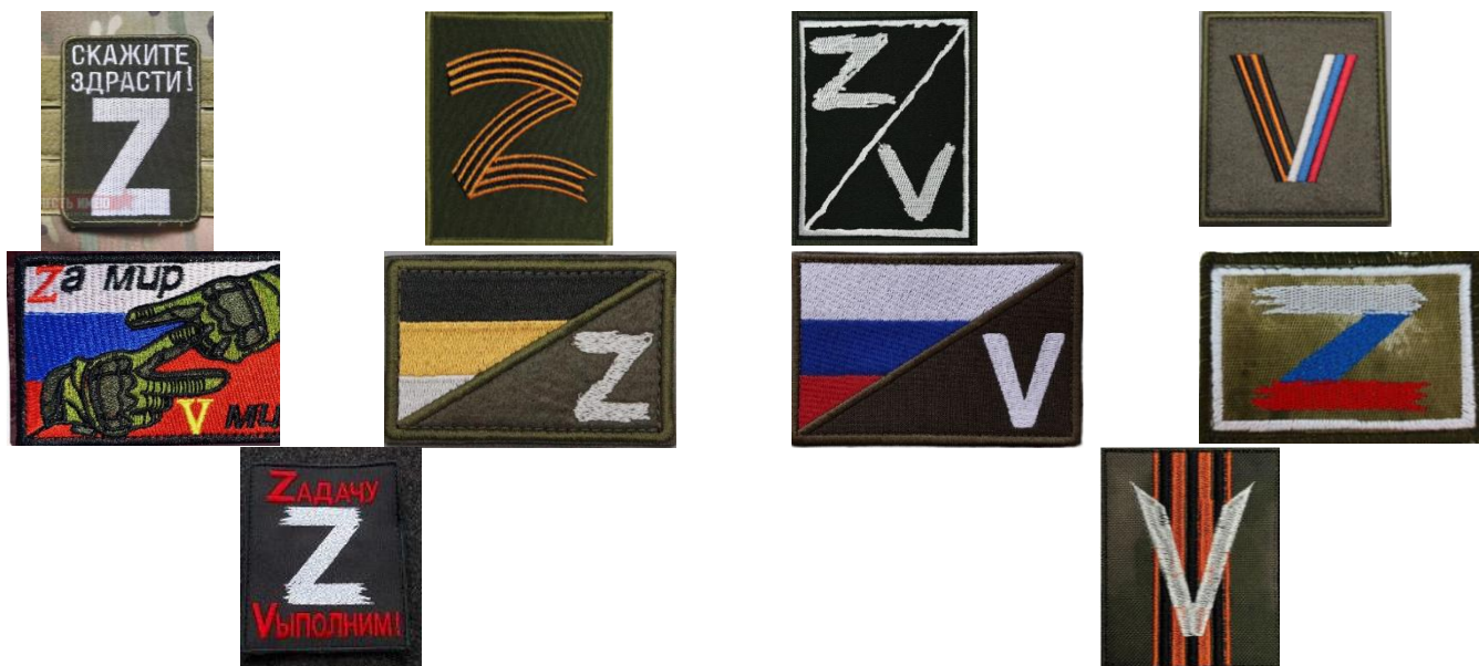
Рисунок 72 – «Полевые» шевроны с произвольным использованием государственной символики

Существующие варианты произвольного использования Z и V представляют собой многочисленные произвольные вариации российской государственной и военной символики. В основном они представлены на так называемых полевых шевронах (рисунок 72).