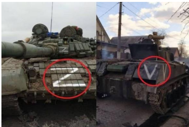
Рисунок 68 – Символы Z и V на российской военной технике

В официальную систему воинских символов Z и V не включены, но получили широкую поддержку россиян, сразу став, фактически, символами времени.