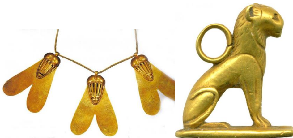
Рисунок 61 – Подвески Золотая муха и Золотой лев

Так в военной организации Древнего Египта получил свое развитие такой важный атрибут воинского этикета, как награды, которые применялись в качестве меры поощрения за проявление доблести в бою. Сначала наградами служили земли, золото, рабы, затем знаки воинского отличия – жезлы, луки, кинжалы. На более поздней стадии развития древнеегипетской армии воинам стали вручать золотые подвески в виде мух и львов 39 (рисунок 61).