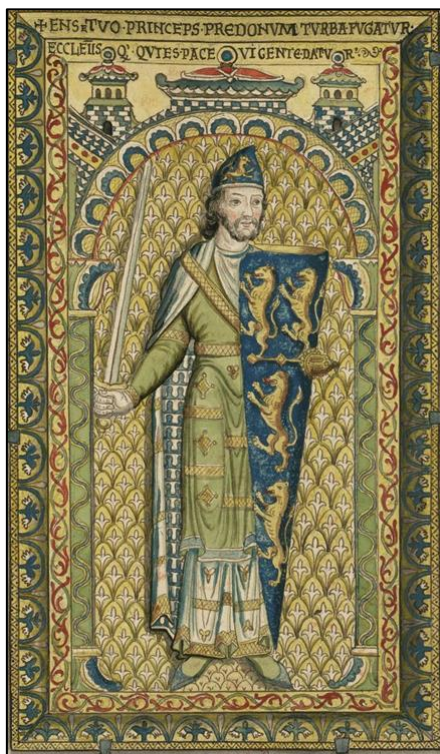
Рисунок 62 – Эмалевый рисунок с гербом Жоффруа Плантагенета

Считается, что самым ранним свидетельством появления геральдического знака является французский эмалевый рисунок с могилы графа Анжу и Мэна Жоффруа Плантагенета (1113 – 1151), изображающий самого графа с гербовым щитом, где на лазоревом поле изображены предположительно четыре вздыбленных золотых льва – точное число львов трудно определить из-за положения, в каком нарисован щит (рисунок 62).