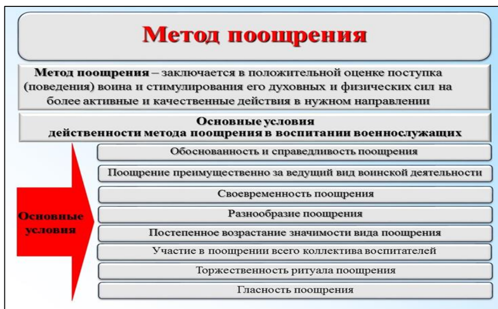
Рисунок 66 – Содержание метода поощрения

Это сплав духовной культуры с трудовым и боевым опытом. Необходимо подчеркнуть, что в качестве традиций в армии в различные исторические периоды и этапы выступали правила для офицеров (воевод), нормы поведения, взгляды, обычаи и педагогические установки на выделение наиболее отличившихся воинов как индивидуально, так и составе коллективов (дружин, ополчений, армий, полков и подразделений). На протяжении веков одни из них крепили и развивались, другие – постепенно теряли свое значение и отмирали, но появлялись новые.