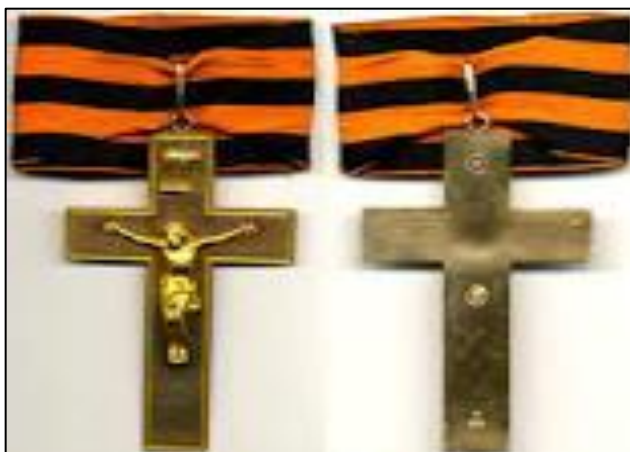
Рисунок 67 – Золотой наперсный крест

г. Павел I учредил Знак отличия ордена Св. Анны, а в 1807 г. Александр I – Знак отличия Военного ордена, который в 1856 г. был разделен на четыре степени, а с 1913 г. получил официальное название «Георгиевский крест» (хотя в обиходе это название неофициально использовалось с первых лет существования этой солдатской награды).