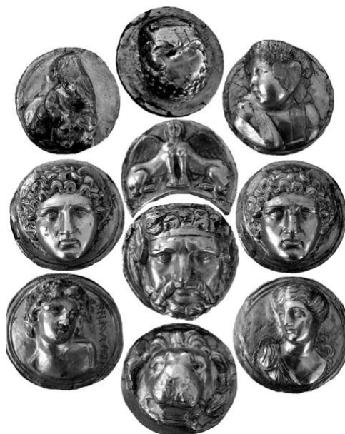
Рисунок 62 – Древнеримские фалеры

В древнеримском войске появился такой вид награды как фалера, представляющая собой большой или маленький диск круглой или овальной формы, размером от 4 до 7 сантиметров. На них наносились изображения, среди которых особенно часто встречались головы Медузы Горгоны, Марса, Минервы, Юпитера, а также головы сфинкса или льва. На некоторых фалерах изображались поодиночке или с сыновьями императоры (Тиберий, Клавдий) или видные военачальники (Германик), что было частью пропаганды императорских династий и выдающихся военных побед (рисунок 62) 40 .