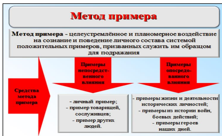
Рисунок 65 – Содержание метода примера