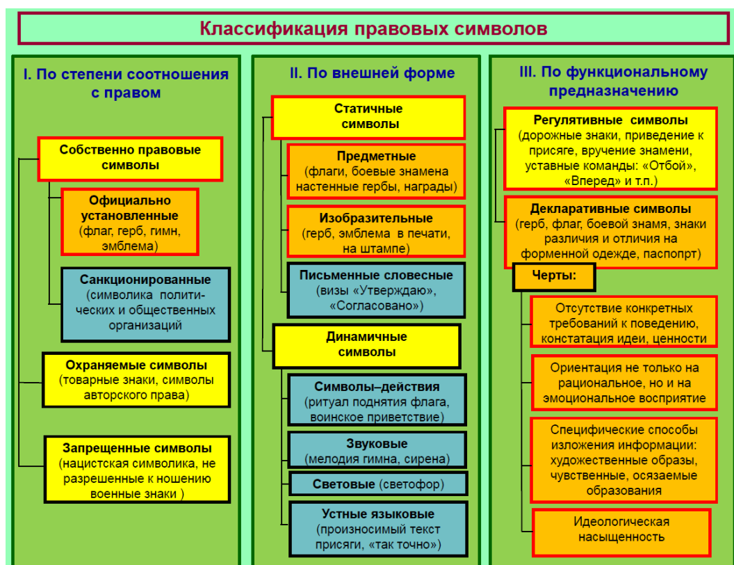
Рисунок 60 – Классификация правовых символов

На этой основе в адаптированном для военной сферы виде классификацию правовых символов можно представить следующим образом (рисунок 60).