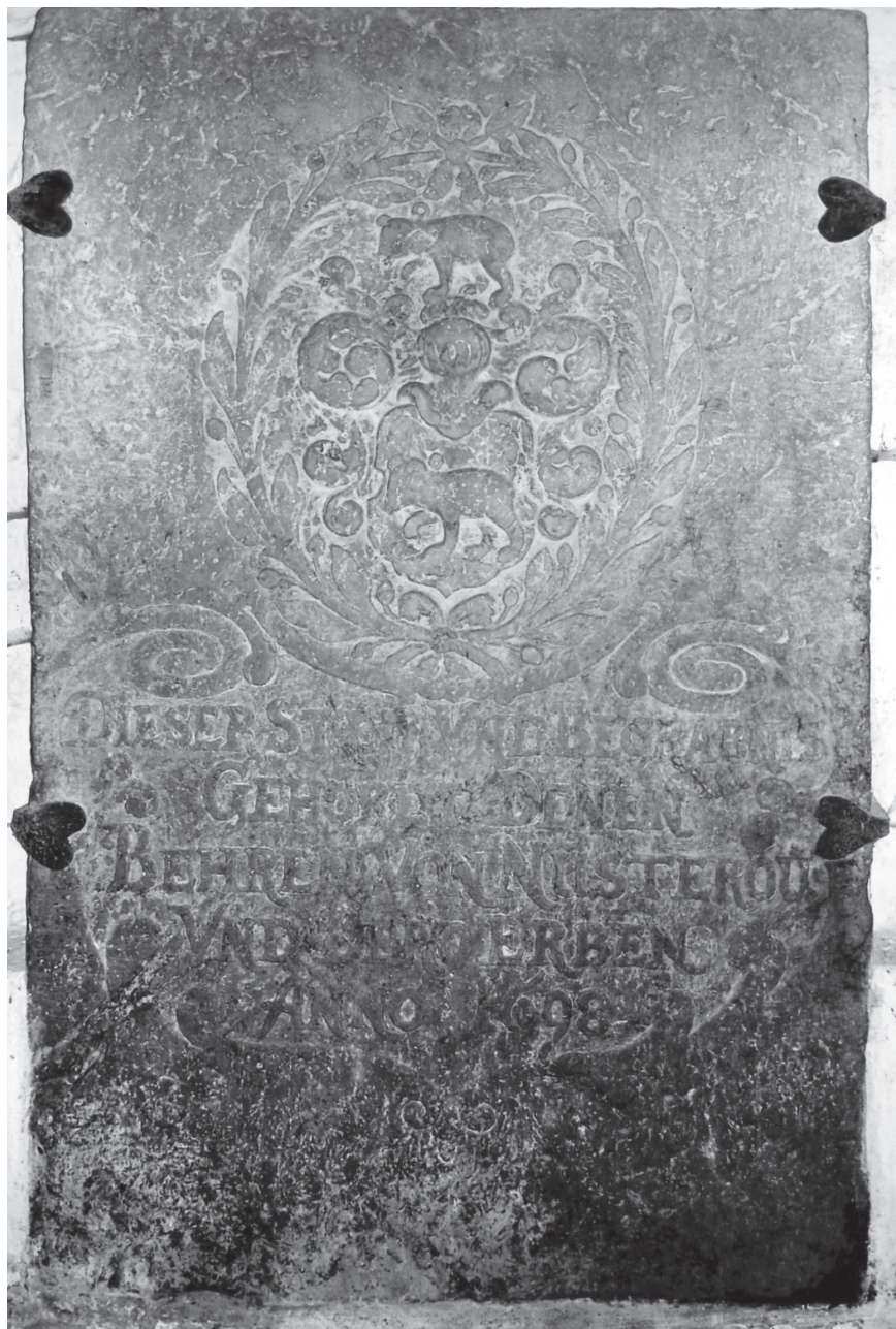
Рис. 2. Герб мекленбургской ветви рода Бер на памятной плите в Dorfkirche в городе Basse (Мекленбург–Передняя Померания). 1698 г.