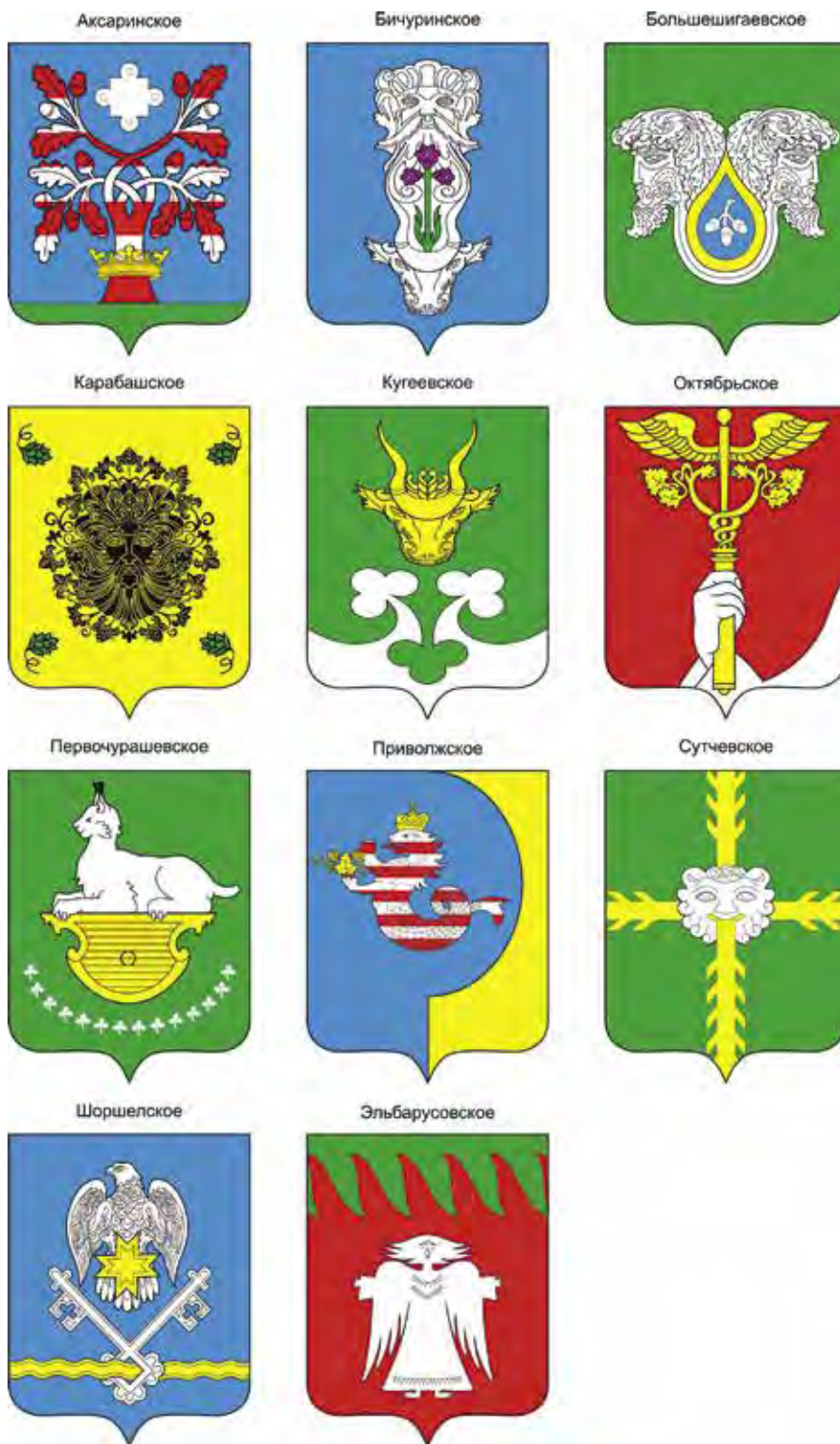
Ил. 9. Гербы сельских поселений Мариинско-Посадского района