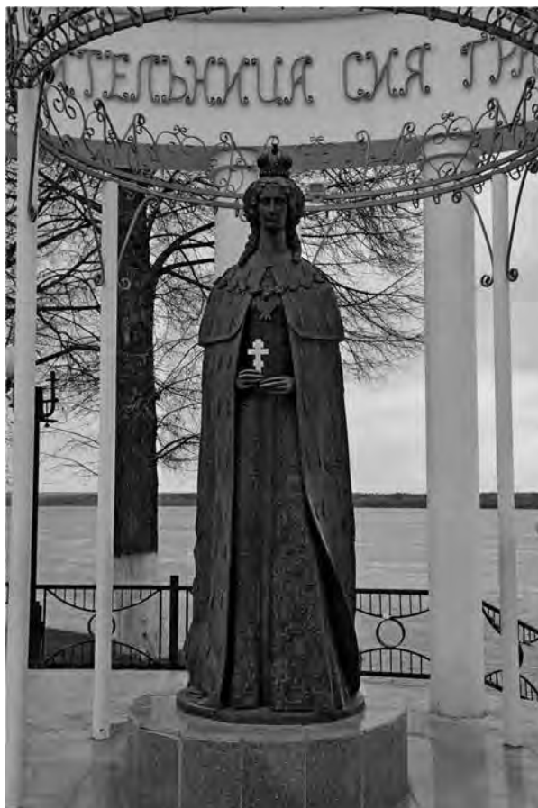
Ил. 1. Памятник императрице Марии Александровне в Мариинском Посаде. Скульптор И. И. Зеленков

Троицы и что оно принадлежало в то время Крутицким митрополитам» 7 . Хотя у того же Перетятковича и в некоторых других документах есть конкретная историческая дата – 1624 год, почему-то она не была взята за основу отсчета основания Сундыря.