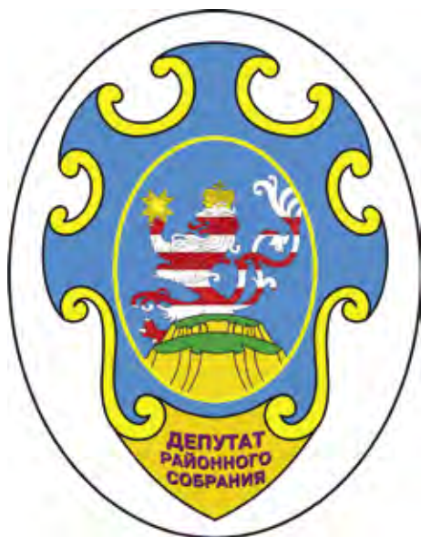
Ил. 11. Нагрудный знак депутата Мариинско-Посадского районного собрания депутатов