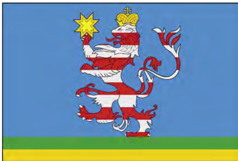
Ил. 8. Флаг Мариинско-Посадского района