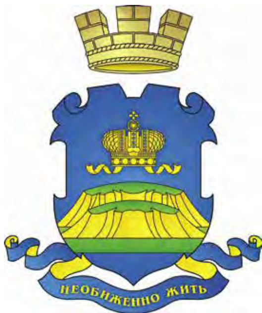
Ил. 5. Герб Мариинского Посада

корону малой императорской, которую носила Мария Александровна. Герольдия помогла составить геральдическое описание герба Мариинского Посада 1999 года: «В лазури (синем, голубом поле) золотая, украшенная золотыми и в цвет поля самоцветами, с золотыми лентами малая Императорская корона (венец Императрицы) над двумя золотыми, с зелеными вершинами, горами, стоящими одна позади другой на зеленой земле; вписанная оконечность в цвет поля. Девиз „НЕОБИЖЕННО ЖИТЬ“ начертан золотыми литерами на лазревой, положенной золотом ленте» 35 (ил. 5).