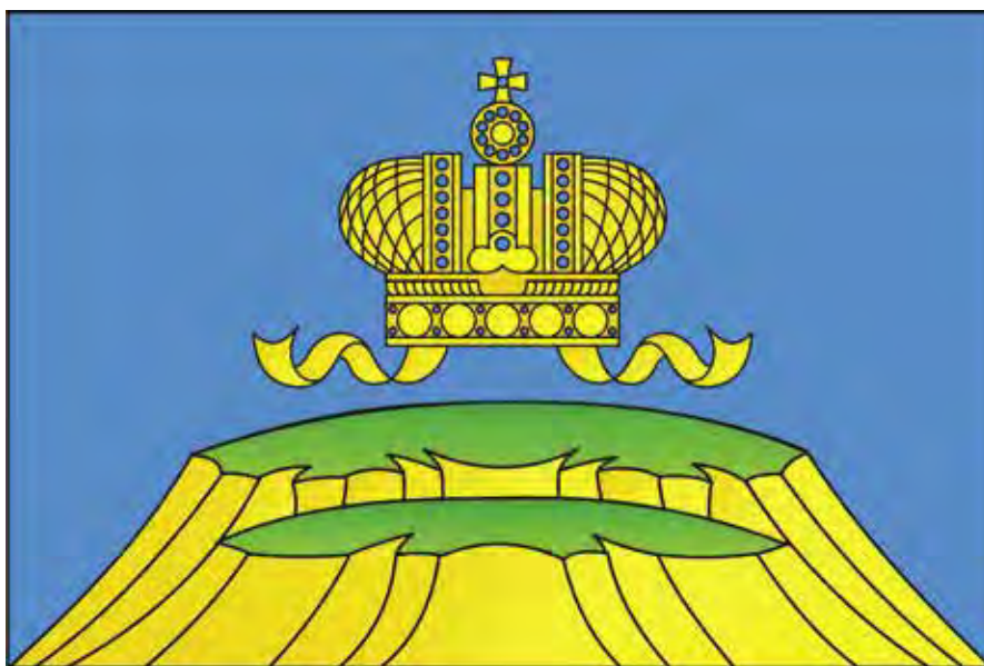
Ил. 6. Флаг Мариинского Посада