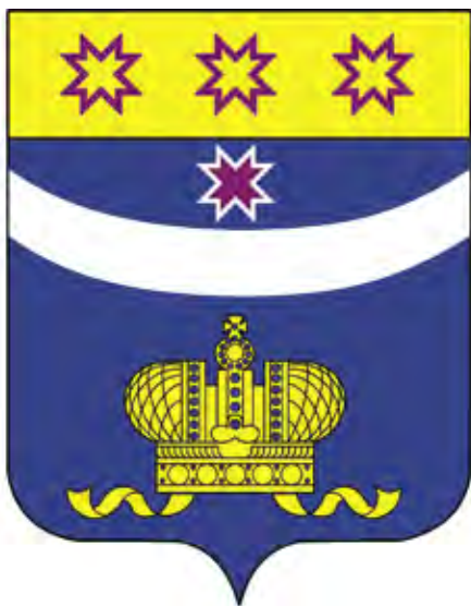
Ил. 3. Проект герба Мариинско-Посадского района