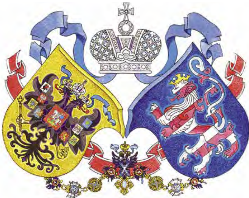
Ил. 10. Рисунок Малого герба императрицы Марии Александровны

художником, десять принадлежат учебным заведениям, расположенным на территории Мариинско-Посадского района, из них шесть находятся в пределах самого города: гимназия №1, Коноваловская общеобразовательная школа, средняя общеобразовательная школа № 2, два профессиональных училища – № 11 и 28, объединенные в технологический техникум и лесотехникум, а также четыре герба школ района – бичуринской, шоршелской, сутчевской и приволжской. Поэтому неудивительно, что большинство сочиненных гербов школ имеет один уникальный символ малой Родины – двуглавую гору. В очерке о Мариинском Посаде 1873 года повествуется, что вид посада еще прекраснее с так называемой Сударевой горы, которая и название свое получила, по объяснению старожилов, от того, что императрица Екатерина II в проезде свой по Волге в 1767 году останавливалась на этой горе кушать и будто бы долго любовалась живописным местоположением Сундыря 52 . Иконографические особенности гербов учебных заведений были рассмотрены мною в выступлении на научной конференции 2019 года в Государственном Эрмитаже 53 . Также недавно напечатана статья «Отражение символики малой родины в гербах учебных заведений Чувашии» в региональном педагогическом журнале «Народная школа» 54 .