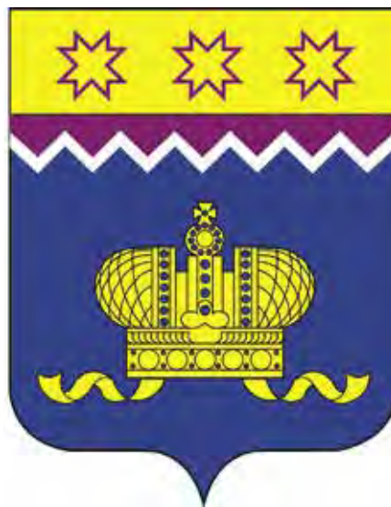
Ил. 4. Проект герба Мариинского Посада

лентами-инфулами: такая композиция не согласуется с геральдическими реалиями отечественной истории); упростить орнамент во главе щита ввиду несоответствия имеющейся версии общим геральдико-графическим нормам; исключить белую каемку щита (в геральдике она может иметь негативное толкование); исключить из описания и иных официальных документов указания на форму, пропорции щита (французской формы и т. д.) 34 .