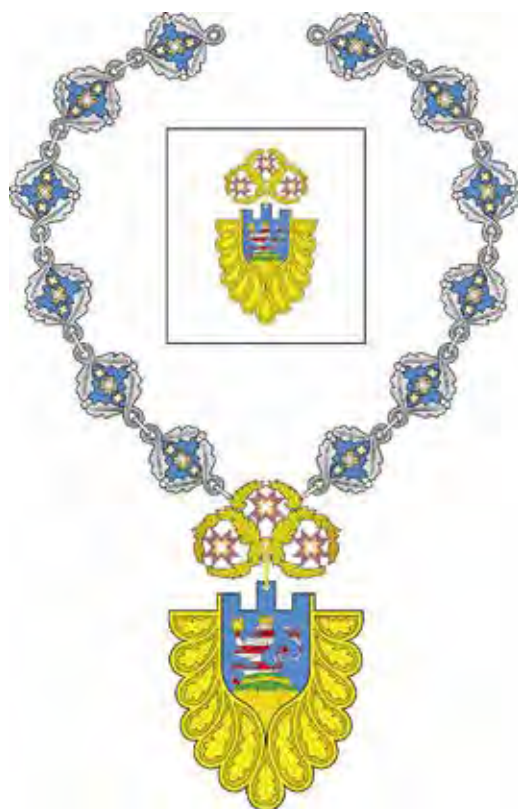
Ил. 13. Должностной и памятный знак главы администрации Мариинско-Посадского района