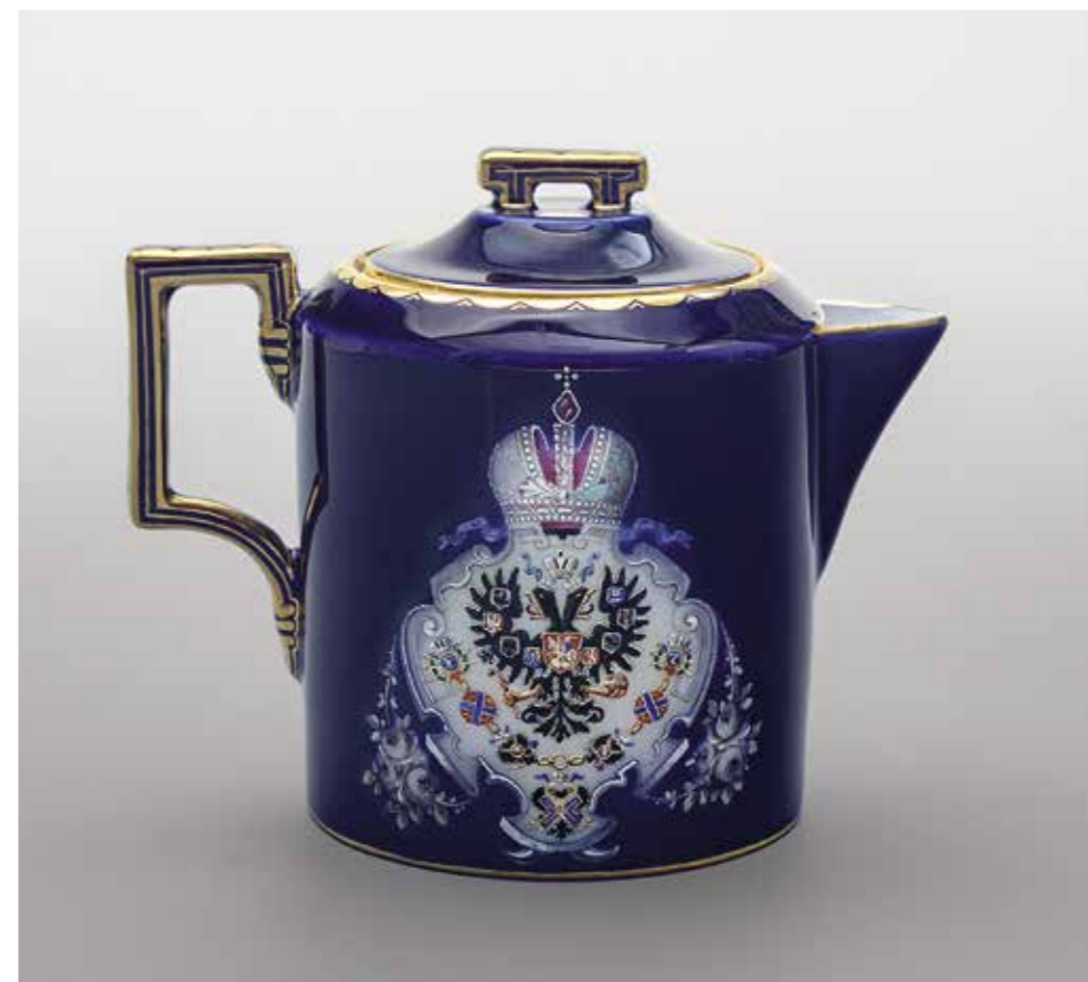
Ил. 3. Сливочник из сервиза с изображением герба под короной. 1882. Инв. № Мз-И-995. Государственный Эрмитаж

На рубеже 1870–1880-х годов на Императорском фарфоровом заводе актуализировалась тема, связанная с историей царствующего дома Романовых и преемственностью правления, и живописцами была исполнена серия чашек с портретами глав династии, получившая в архивных документах название «Чашки с портретами царствовавших лиц дома Романовых» 7 (ил. 6). В качестве живописных