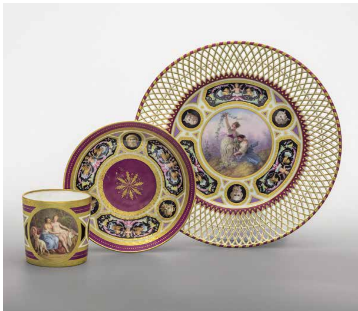
Ил. 8. Предметы из сервиза с гротескным орнаментом. 1870–1880-е. Императорский фарфоровый завод. Инв. № МЗ-И-1096 а, б; МЗ-И-1092. Государственный Эрмитаж

на рубеже 1880–1881 годов, были завершены уже при императоре Александре III, которому готовый сервиз был поднесен к Рождеству 1882 года.