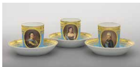
Ил. 6. Предметы из серии «Чашки с портретами царствовавших лиц дома Романовых». Конец 1870-х – начало 1880-х. Императорский фарфоровый завод: а – чашка с портретом императора Петра I, инв. № Мз-И-1011; б – чашка с портретом императрицы Екатерины I, инв. № Мз-И-1012; в – чашка с портретом императора Павла I, инв. № Мз-И-1017. Государственный Эрмитаж

смерти государя были составлены описи предметов, находившихся в комнатах Александра III в бельэтаже Арсенального каре Гатчинского дворца. На половине Александра III хранилось большое количество произведений Императорских фарфорового и стеклянного заводов, поднесенных в разные годы к праздникам Рождества и Пасхи, в том числе некоторые сервизы. Записи датированы 19 декабря 1894 года. В первой же комнате на подоконнике можно было обнаружить знакомые нам предметы: «№ 271. Чашек кофейных фарфоровых кобальтового цвета с живописным Императорским гербом под короною, с золоченою ручкой и блюдцем каждая – двенадцать. В футляре, оклеенном снаружи коленкором под шагрень синего цвета, а внутри белую бумагой» 17 .