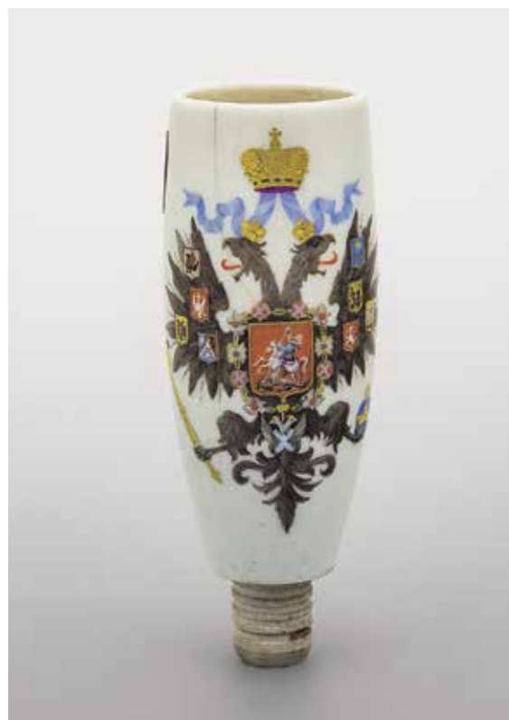
Ил. 4. Трубка курительная с изображением Малаго государственного герба Российской империи. Начало 1880-х. Императорский фарфоровый завод. Инв. № Мз-И-1509. Государственный Эрмитаж