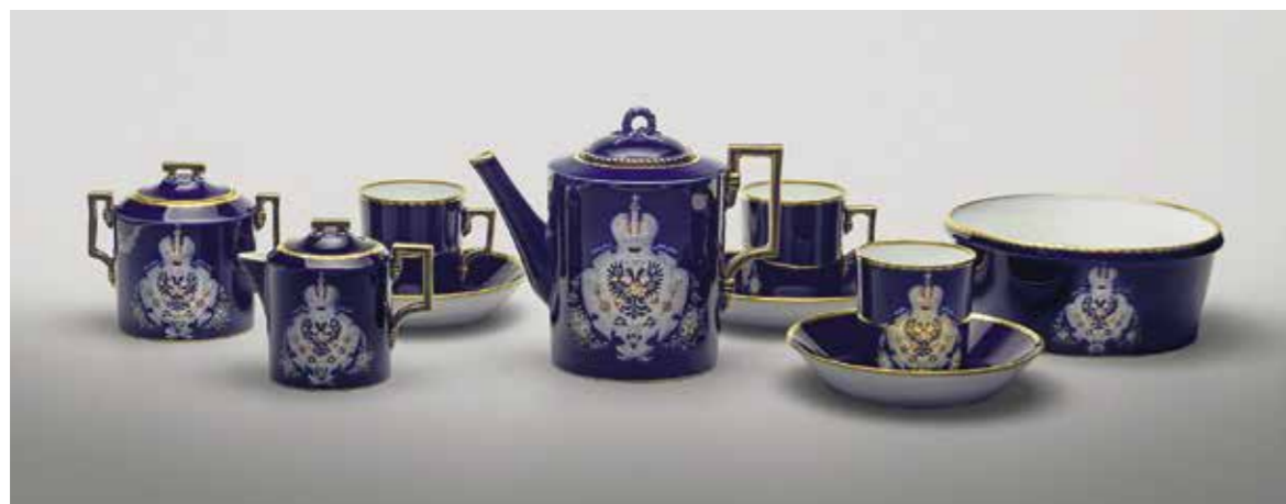
Ил. 1. Предметы сервиза с изображением герба под короной. 1881–1882. Императорский фарфоровый завод. Инв. № Мз-И-994–1000. Государственный Эрмитаж. Фрагмент на с. 49