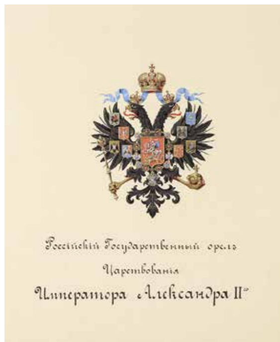
Ил. 5. Рисунок Малаго государственного герба Российской империи. Вторая половина XIX в. Инв. № ЭРР-3037. Государственный Эрмитаж Фрагмент на с. 51

называемой «высробке Гербов», т. е. расчистке резервов на покрытом кобальтом предмете под живопись. Исходя из трудоемкости исполнения, каждый предмет был оценен в немалую сумму: большие и малые чайники стоили 100 и 90 рублей соответственно, сахарницы – 90 рублей, сливочники и полоскательные чаши – 75 рублей. В конце года были исполнены десертные тарелки – «прорезные кобальтовые с гербами, украшение золотом, стоимостью 100 рублей каждая», которые дополнили сервизный комплекс 11 .