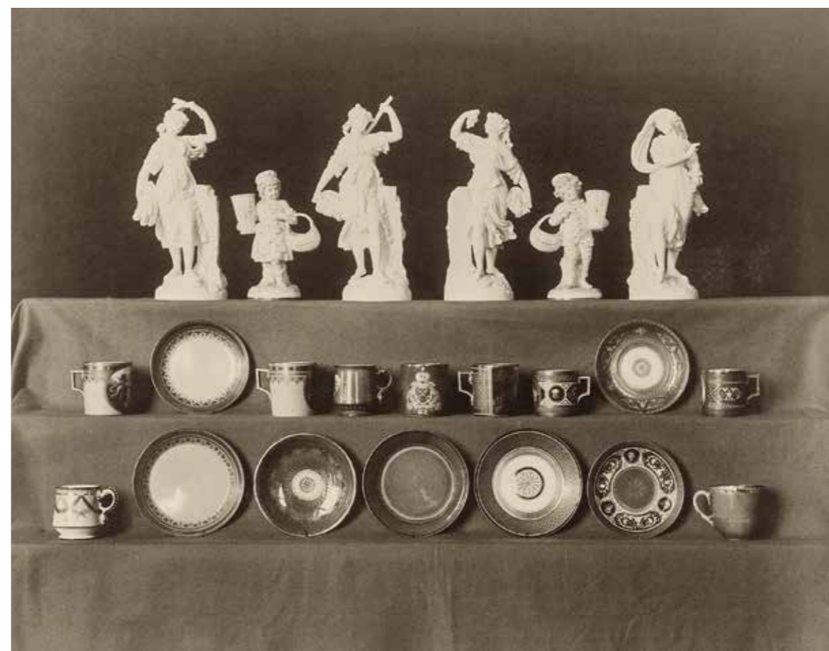
Ил. 7. Предметы из коллекции музея Императорского фарфорового завода. Фотография 1892 г. Инв. № Мз-Фт-325.

В собрании фарфора Государственного исторического музея хранятся шесть предметов, тот же состав, что был передан в музей фарфорового завода, только у чайника сохранилась «родная» крышка 21 . Предметы поступили в 1939 году из Го-