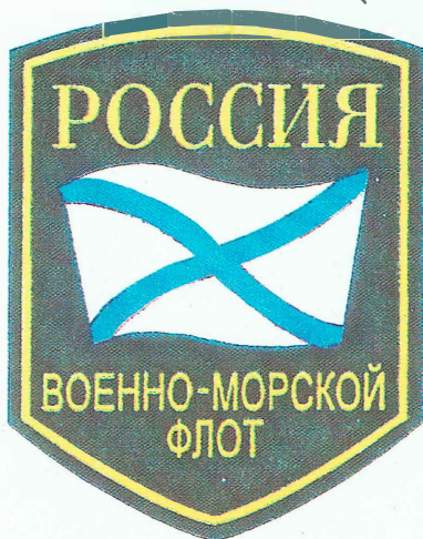
НАРУКАВНЫЙ ЗНАК ВОЕННОСЛУЖАЩИХ ВМФ