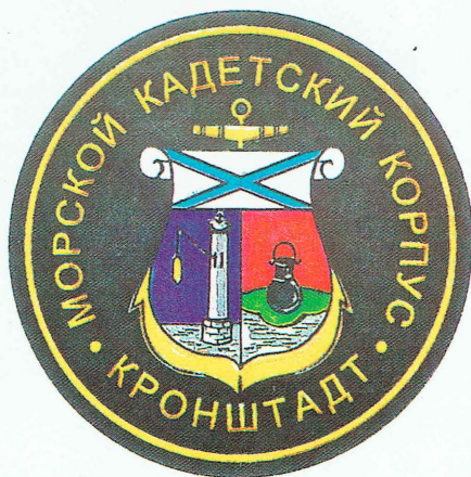
НА ПРАВЫЙ РУКАВ

Нарукавные знаки Кронштадтского Морского кадетского корпуса Художник В.К. Рожков