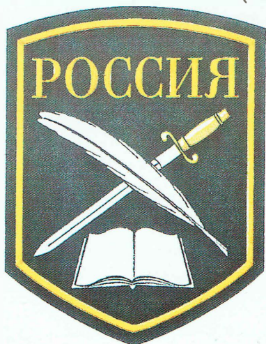
НА ЛЕВЫЙ РУКАВ