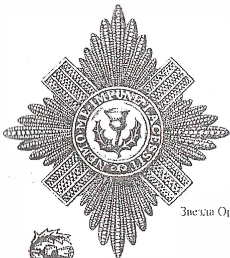
Звезда Орлена Чертополоха