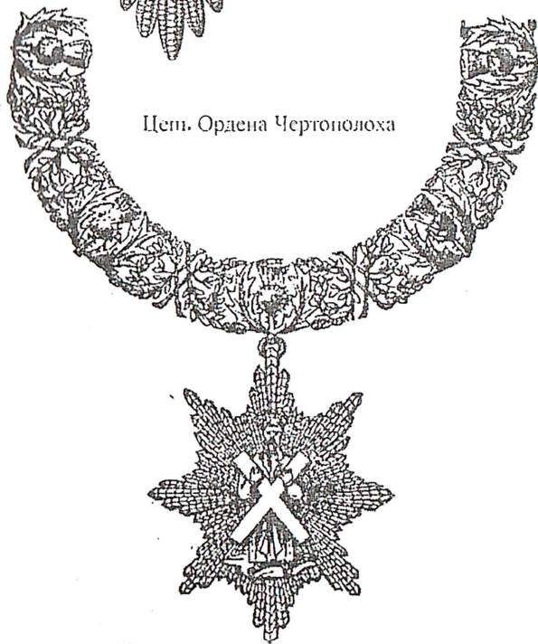
Цепь Ордена Чертополоха