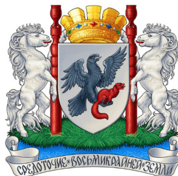
Рис. 4. Полный герб г. Якутска (2012 г.)

Официальное описание нового герба Якутска (рис. 4). «В серебряном поле – черный орел, летящий влево, имеющий одно крыло опущенное, а другое воздетое, и поддерживающий лапами с опущенным хвостом червленого соболя. Щит увенчан золотой башенной короной о пяти зубцах, дополненной двумя обручами того же металла: верхний – с самоцветами, нижний – с рельефным якутским орнаментом. Щитодержатели – два серебряных с червлеными языками якутских коня, поддерживающих по сторонам от щита червленые сэрэ, увенчанные коронами того же цвета. Все – на подножии в виде зеленой травы, ниже которой видна лазоревая вода».