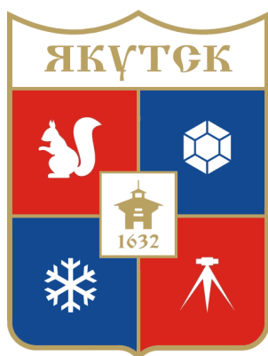
Рис. 3. Герб Якутска 1967, 1995 гг.

Описание герба и обоснование символики герба гласило: «За основу герба принята классическая форма геральдики – четырехугольный щит с заострением внизу. Щит завершается венчающей частью типа короны, где размещено название столицы – «Якутск». Герб разделен на четыре равные части. В середине – изображение силуэта башни Якутского острога с датой основания города. В каждой части герба скомпонованы элементы основных отличительных характеристик Республики Саха (Якутия): белка символизирует уникальный животный мир, алмаз – несметные богатства недр земли, снежинка – суровый климат Северного края, теодолит – новые преобразования и открытия в республике. Цветовая гамма принята следующая: название столицы и изображение башни с датой основания – золотистые на белом фоне; изображение белки и теодолита – белые на красно-бордовом фоне; изображение алмаза и снежинки – белые на светло-голубом фоне; разделительные и окантовочные линии золотистого цвета» [9] (рис. 3).