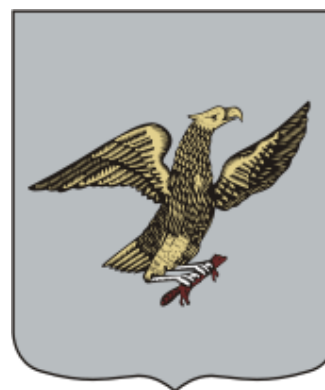
Рис. 2. Герб Якутска 1790 г.

В период становления Советской власти геральдика была предана забвению, и только 12 сентября 1967 г. у Якутска появится новый советский герб (рис. 2).