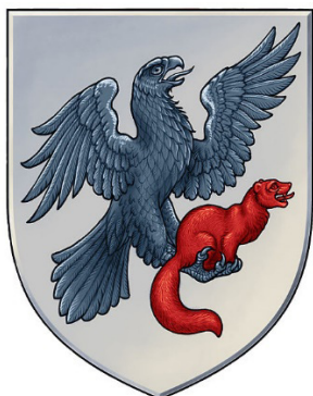
Рис. 5. Герб г. Якутска (2012 г.)