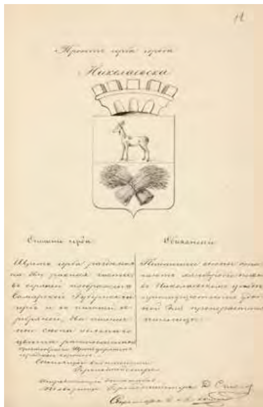
Ил. 7. Переработанный в герольдии проект герба города Николаевска, выполненный в Статистическом отделении Совета МВД. Министерство юстиции. 1855. РГИА. Ф. 1343. Оп. 15. Д. 219. Л. 12

«Имею честь представить Вашему Превосходительству следующие на предварительное рассмотрение г. министра юстиции проекты герба для города Николаевска Самарской губернии: один, полученный из Министерства внутренних дел, и другой, составленный в Департаменте герольдии; считаю при сем долгом присовокупить, что изготовленный в Мин[истерстве] внут[ренних] дел проект герба для г. Николаевска совершенно сходен с выс[очайше] утверж[денным] 18 Авг[уста] 1781 гербом города Шацка Тамбовской губ., в коем в верхней части изображен Тамбовский губернский герб, а в нижней, в серебряном поле, – два накрест положенных ржаных снопа, а потому в Канцелярии 3-й экспедиции заготовлен другой проект» 14 .