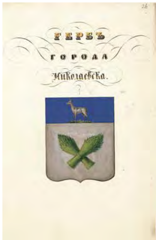
Ил. 1. Проект герба города Николаевска. Министерство внутренних дел. 1851. РГИА. Ф. 1343. Оп. 15. Д. 219. Л. 26