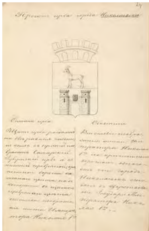
Ил. 8. Проект герба города Николаевска. Министерство юстиции. 1855. РГИА. Ф. 1343. Оп. 15. Д. 219. Л. 24, 24 об.