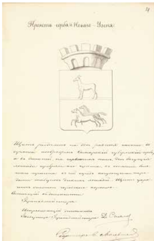
Ил. 6. Проект герба города Нового Узенья. Министерство юстиции. 1855. РГИА. Ф. 1343. Оп. 15. Д. 219. Л. 21

Полученный ответ отличается лаконичностью. Что можно взять из представленной справки? Практически ничего, за исключением того, что поселение появляется в бытность императора Николая I. Тем не менее Д. В. Стасов работает с полученным материалом и 22 сентября 1855 года направляет герольдмейстеру В. Д. Философову рапорт по гербу города Николаевска: