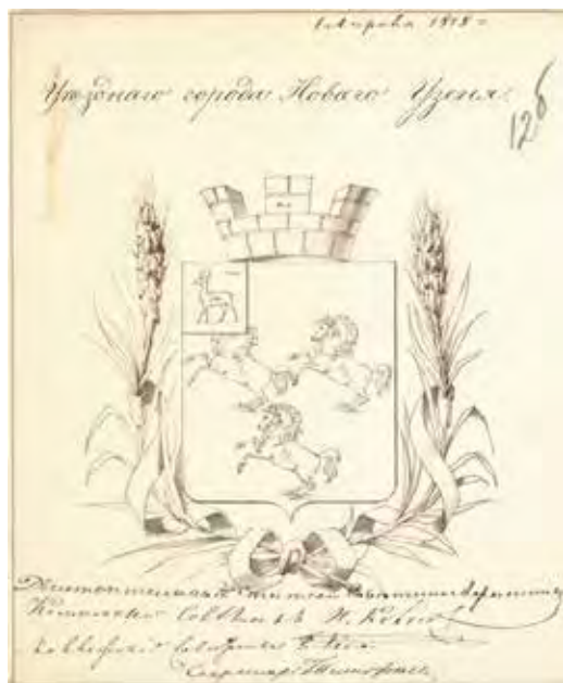
Ил. 14. Проект герба города Нового Узеня. Гербовое отделение Департамента герольдии. 1858. РГИА. Ф. 1343. Оп. 15. Д. 220. Л. 12б

Дело по ордеру господина герольдмейстера, от 3 декабря 1898 года за № 1095, об изготовлении проекта герба городу Новоузенску Самарской губернии. Обстоятельства настоящего дела таковы: министр внутренних дел при рапорте от 2 марта 1898 года