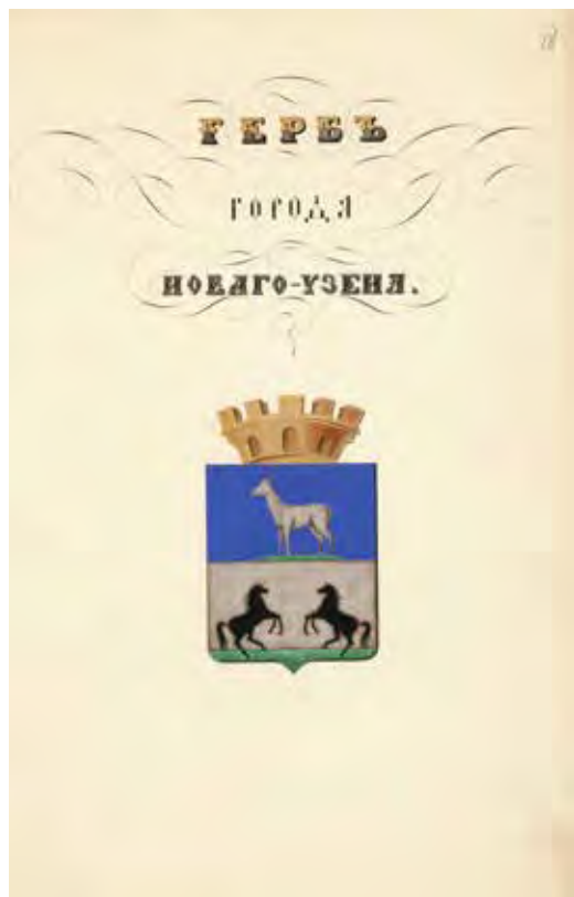
Ил. 10. Проект герба города Нового Узенья. Министерство внутренних дел. РГИА. Ф. 1343. Оп. 15. Д. 219. Л. 18