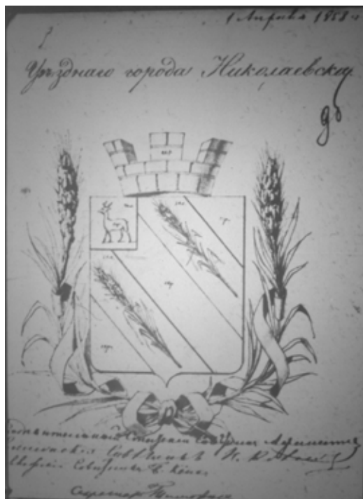
Ил. 13. Проект герба города Николаевска. Гербовое отделение Департамента герольдии. 1858. РГИА. Ф. 1343. Оп. 15. Д. 220. Л. 9б

«В серебряном поле – три червлёные скачущие лошади с золотыми уздами. В вольной части – герб Самарской губернии.