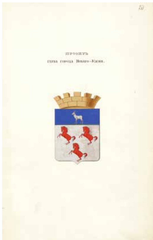
Ил. 11. Проект герба города Нового Узенья. Министерство внутренних дел. 1856–1857 (?). РГИА. Ф. 1343. Оп. 15. Д. 219. Л. 20