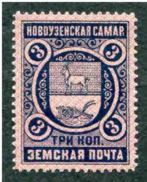
Ил. 17. Земская марка Новоузенского уезда. 1896. Коллекция автора

Дело по ордеру господина герольдмейстера от 29 января сего года, за № 92, об изготовлении проекта герба городу Николаевску Самарской губернии. Обстоятельства настоящего дела следующие: министр внутренних дел при рапорте от 5 сентября 1908 г., за № 5515, представил Правительствующему Сенату полученное им отношение самарского губернатора от 4 августа того же 1908 г. за № 1160, в коем последний изъяснил, что Николаевская Городская дума ходатайствует об утверждении герба для города Николаевска по рисунку, составленному в городской управе. При рисунке сем приложено и такое описание его: „В верхней части щита герб губернского города (коза на голубом поле); в нижней части под серебряным сиянием, на зеленом поле два золотых снопа хлеба, валы сена и земледельческие орудия (белого цвета): плуг, борона, серп, коса