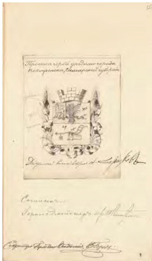
Ил. 16. Проект герба города Новоузенска. Гербовое отделение Департамента герольдии. 1899. РГИА. Ф. 1343. Оп. 15. Д. 221. Л. 15

к бахмутскому типу, названному по первой марке, выпущенной для бахмутского земства в 1878 году. К этому типу относят марки, изготовленные для десяти уездов Российской империи в 1878–1916 годах, с большим количеством вариаций, отличающихся разными номиналами, бумагой, цветами рисунка, зубцовым и беззубцовым исполнением. Забегая вперед, заметим также, что город Николаевск земской марки не имел.