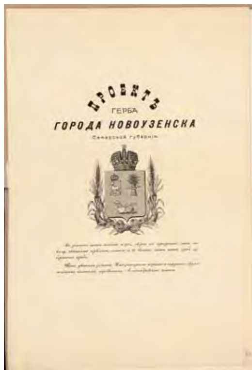
Ил. 15. Местный проект герба города Новоузенска. 1897. РГИА. Ф. 1343. Оп. 15. Д. 221. Л. 56

за № 2118 представил Правительствующему Сенату полученное им отношение самарского губернатора от 17 февраля того же года, при котором приложена выписка из журнала собрания Новоузенской городской думы следующего содержания: