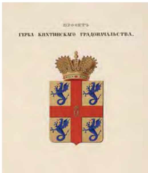
Ил. 12. Проект герба Кяхтинскаго градоначальства. Министерство внутренних дел. 1856. РГИА. Ф. 1343. Оп. 15. Д. 293. Л. 26