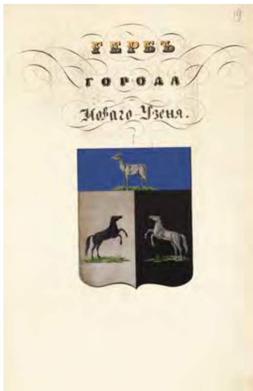
Ил. 2. Проект герба города Нового Узень. Министерство внутренних дел. 1851. РГИА. Ф. 1343. Оп. 15. Д. 219. Л. 19