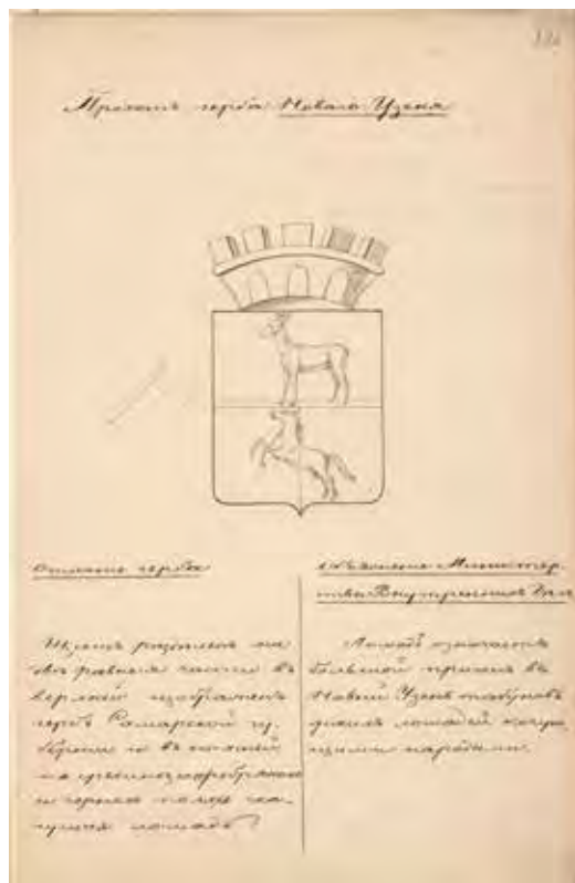
Ил. 3. Проект герба города Нового Узеня. Министерство юстиции. 1854 (?). РГИА. Ф. 1343. Оп. 15. Д. 219. Л. 22