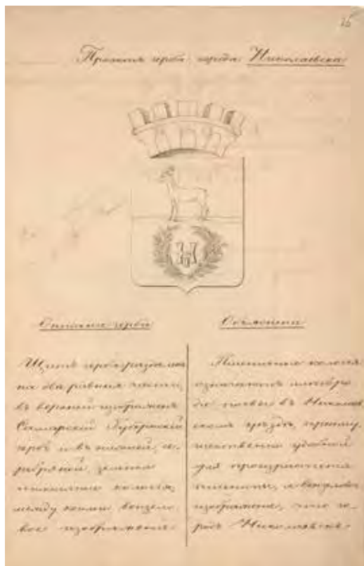
Ил. 9. Проект герба города Николаевска. Министерство юстиции. 1855. РГИА. Ф. 1343. Оп. 15. Д. 219. Л. 25, 25 об.

Гербового отделения Департамент Министерства юстиции имеет честь препроводить при сем представленные в Министерство из Департамента герольдии четыре проекта герба для города Нового Узень Самарской губернии, а также проект герба, полученный из Министерства внутренних дел, с тем, не угодно ли будет Вам, милостивый государь, в дальнейшем ходе производящегося в Департаменте герольдии дела о гербе для города Нового Узень поступить согласно правилам, изъясненным в положении о Гербовом отделении» 20 .