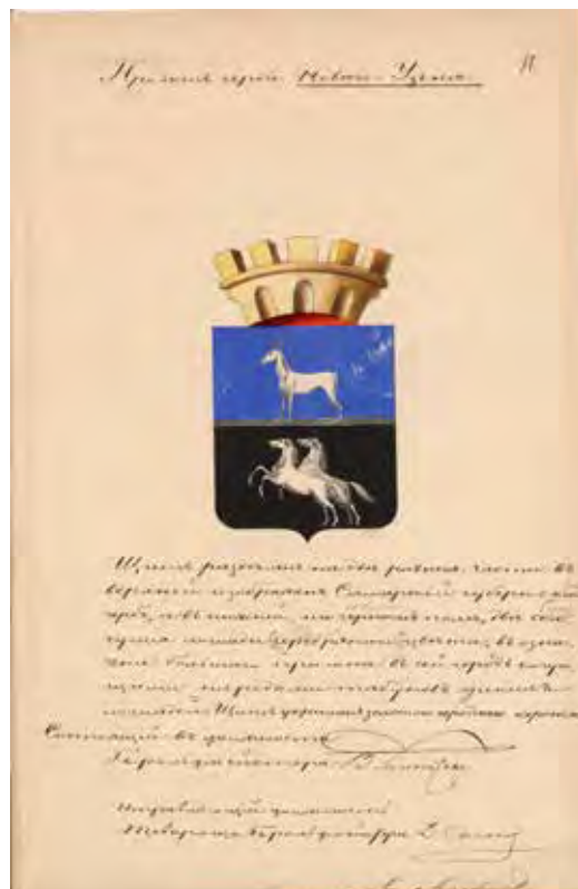
Ил. 4. Проект герба города Нового Узеня. Министерство юстиции. 1855. РГИА. Ф. 1343. Оп. 15. Д. 219. Л. 11