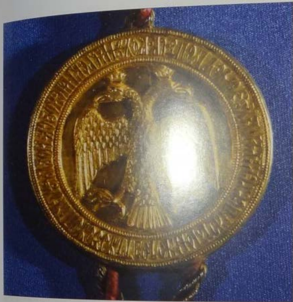
14. Височна золота медаль Вільгельма III при поводанні договору з герцогом Максиміліаном (1514 г.) Österreichisches Staatsarchiv Wien, Hof- und Staatsarchiv AUR 1514 III 7