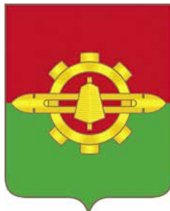
Ил. 34. Герб городского округа «город Клинцы»

это символически обозначено золотой пятиконечной звездой, которая одновременно означает мужество, героизм и отвагу.