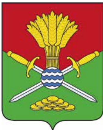
Ил. 14. Герб Челховского сельского поселения