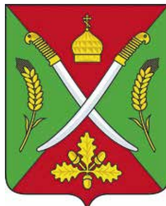
Ил. 9. Герб Лопатенского сельского поселения

войны 1812 г., созданный помещиком Шведом в первой половине XIX в. Геометрические линии липовых аллей представляли собой изображения щита и меча. Композиция также повторена в гербе в виде фигур липы, меча и воинского щита. Меч и щит – это одновременно символы защитников своей земли – и в годы Великой Отечественной войны, и сейчас (в период специальной военной операции) местные жители героически защищали и защищают свою Родину.