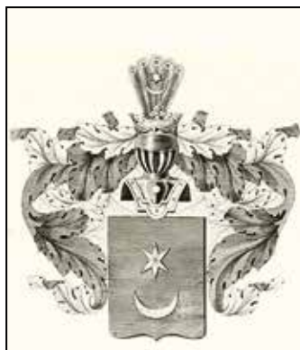
Ил. 2. Герб рода Лашкевичей. Воспроизводится по: Общий гербовник дворянских родов Всероссийской империи. Ч. 7. СПб., [1803]. С. 161. Научная библиотека Государственного Эрмитажа