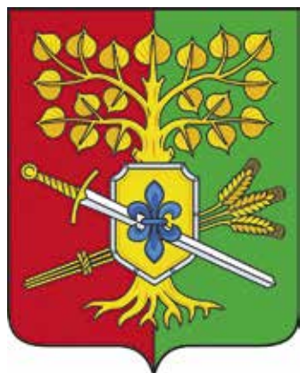
Ил. 7. Герб Лакомбудского сельского поселения