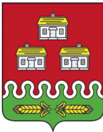
Ил. 16. Герб Гулевского сельского поселения

В червленом поле над зеленой облаковидной оконечностью, окаймленной серебром и обремененной двумя золотыми противоположенными колосками в пояс, – три серебряные с золотыми кровлями избы 14 (ил. 16).