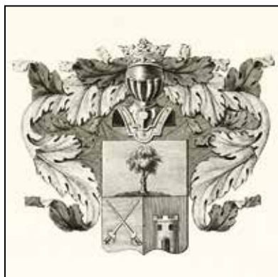
Ил. 6. Герб рода Суковкиных. Воспроизводится по: Общий гербовник дворянских родов Всероссийской империи. Ч. 7. СПб., [1803]. С. 143. Научная библиотека Государственного Эрмитажа

В гербе также нашла отражение старинная легенда о чудесном обретении на землях Кирилловского сельского поселения чудотворной иконы. Легенда гласит, что давным-давно около реки Трубеж поселился какой-то монах, и звали его Максим. Он с помощью жителей построил из камня келью. Так и образовался монастырский скит. Мимо монастыря проходил шлях, который тянулся на Семеновку из Чернигова. По этому шляху проходили шведы. Они разграбили монастырь, взяли лучшие иконы. Около монастыря росло три красивых дуба. И вдруг на одном дубе появилась икона Св. Николая Чудотворца. Ее сняли, но и на другой день икона вновь появилась на дубе. В гербе поселения эта красивая легенда символически обозначена фигурами дуба и иконы Николая Чудотворца. Одновременно икона символизирует село Шумиловка, поселенное в 1694 г. основателем Каменского монастыря монахом Ионой.