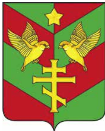
Ил. 29. Герб Чуровичского сельского поселения