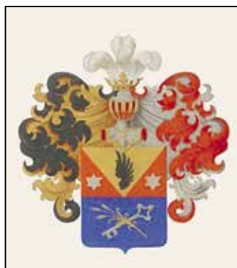
Ил. 8. Герб Немировича-Данченко. Воспроизводится по: Общий гербовник дворянских родов Всероссийской империи. Ч. 11. С. 121. РГИА. Ф. 1411. Оп. 1. Д. 101