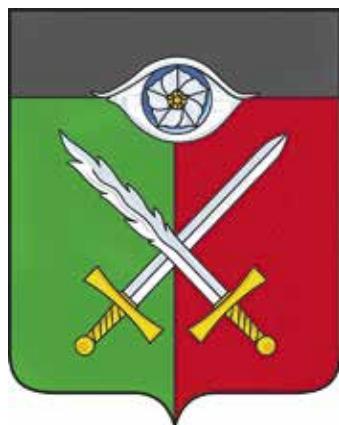
Ил. 17. Герб Истопского сельского поселения