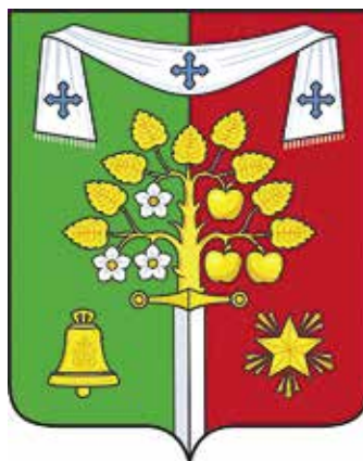
Ил. 26. Герб Сачковичского сельского поселения