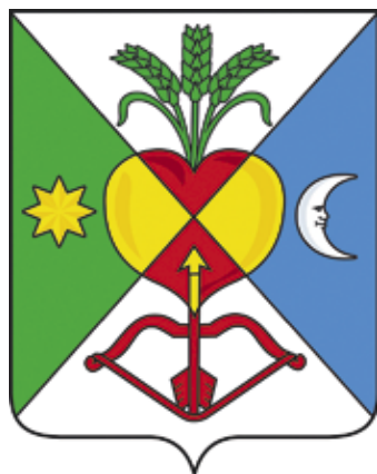
Ил. 10. Герб Медведовского сельского поселения