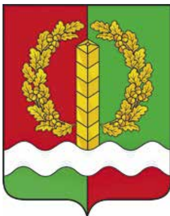
Ил. 30. Герб Хороменского сельского поселения