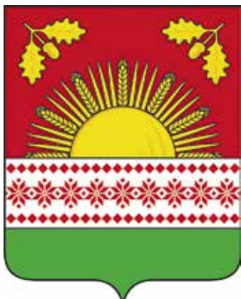
Ил. 33. Герб Клиновского муниципального района