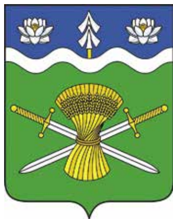
Ил. 23. Герб Плавенского сельского поселения