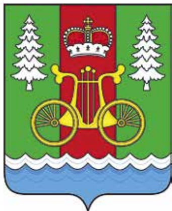
Ил. 32. Герб Жуковского муниципального округа