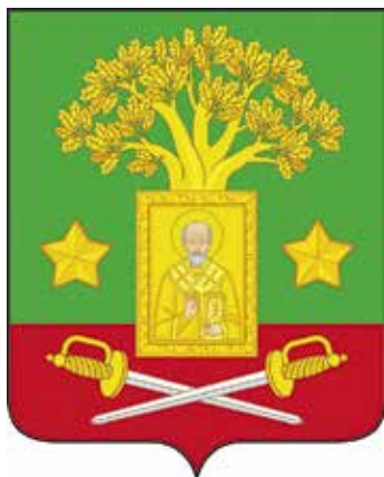
Ил. 5. Герб Кирилловского сельского поселения