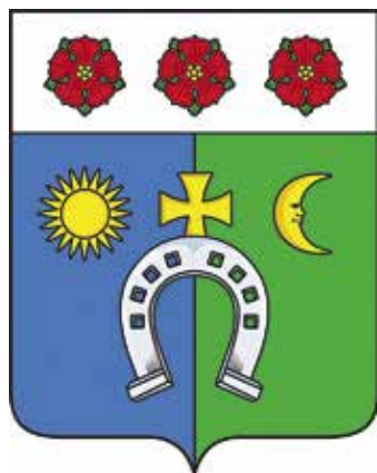
Ил. 13. Герб Смотровобудского сельского поселения