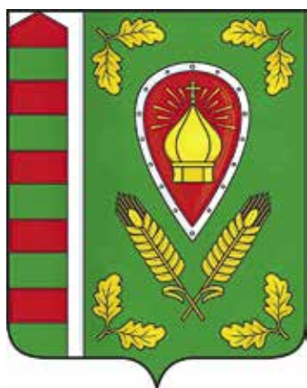
Ил. 20. Герб Новоропнского сельского поселения