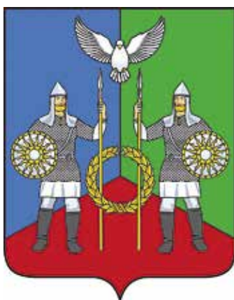
Ил. 21. Герб Новояорковичского сельского поселения