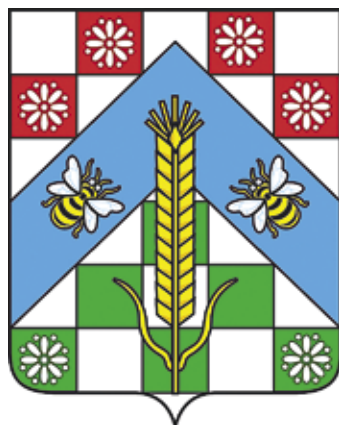
Ил. 25. Герб Рожновского сельского поселения