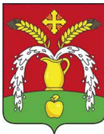
Ил. 22. Герб Первомайского сельского поселения

копья в столб, древки которых продеты в золотой развязый сверху и оплетенный внизу лентой лавровый венок; все сопровождается во главе серебряным с золотыми глазами, клювом и поджатыми лапками летящим прямо с распростертыми крыльями голубем 21 (ил. 21).