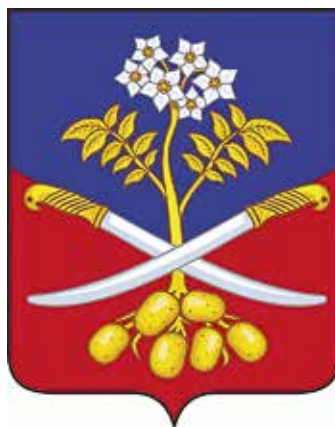
Ил. 28. Герб Сытобудского сельского поселения

и промышленные производства, в первую очередь по изготовлению строительной продукции. В XVIII в. здесь располагался знаменитый стекольный завод, а в настоящее время одним из крупнейших предприятий является Клиновский силикатный завод в поселке Чемерна. Производство стекол и строительной продукции (в первую очередь, кирпичное производство) аллегорически в гербе показано делением узким серебряным крестом щита на «блоки».