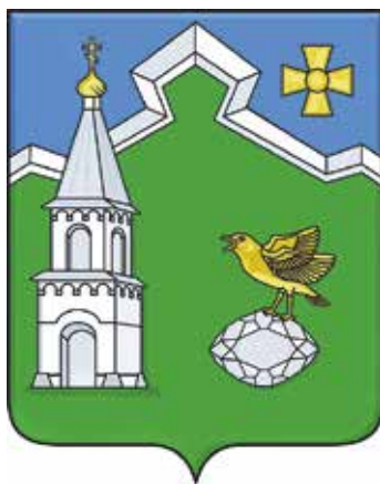
Ил. 12. Герб Каменскохуторского сельского поселения

Село Каменский Хутор, центр Каменскохуторского поселения, начинает свое существование в 1690-х гг. как владение Каменского Успенского монастыря. Монастырь был основан в 1681 г. старцем Ионою Болховским на правом каменистом берегу реки Снов. В гетманском универсале указывалось: «Пречестный отец Иона, строитель монастыря нововозведенного Каменского, сообщил нам, что в полку Стародубском, под слободою Семеновскою, на пустом острове, лежащем у реки Снов, и называемый этот остров „Камень“, воздвиг фундамент церкви Успения Пресвятой Богородицы и просил немедленного подтверждения принадлежащих монастырю земель...» 11 Самыми известными строениями на территории монастыря были Успенский собор и колокольня с въездными воротами. Каменскохуторское поселение с древнейших времен и до наших дней является приграничным форпостом русских земель, прикрывая и защищая важнейшие рубежи Отечества. Важной страницей в истории поселения явилась Великая Отечественная война, наполненная актами беспримерного героизма. Многие жители отдали свои жизни, защищая Отечество и родную землю. Кроме того, на территории поселения в урочище Вересы был запасной партизанский аэродром. В селе Соловьевка родился Герой Советского Союза Александр Захарович Носовец. Также Каменскохуторское сельское поселение является родиной Александра Дмитриевича Клецкова – вице-адмирала, командующего Черноморским флотом. В Каменском Хуторе есть памятник природы областного значения – Монахова криница.