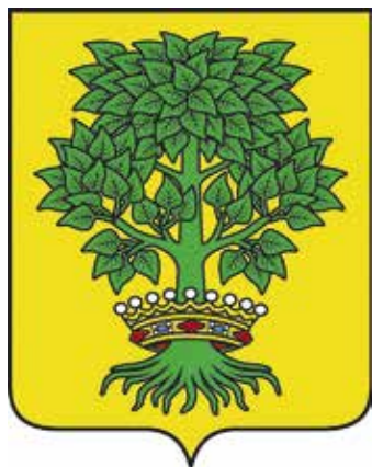
Ил. 3. Герб Великотопальского сельского поселения