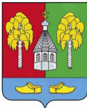
Ил. 18. Герб Коржовоголубовского сельского поселения