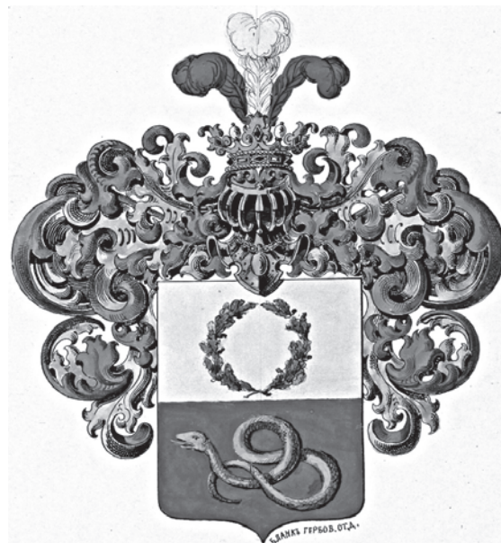
Рис. 4. Рисунок герб Цемшей, утвержденный в 1855 г. 29

На основе проекта герба Поплавских был подготовлен формуляр 30 и, с одобрения министра юстиции, в 1855 г. изготовлен Дворянский диплом с гербом, для направления его на Высочайшее утверждение с описанием: «В черном поле золотой корабль. Щит украшен дворянским шлемом и ко-