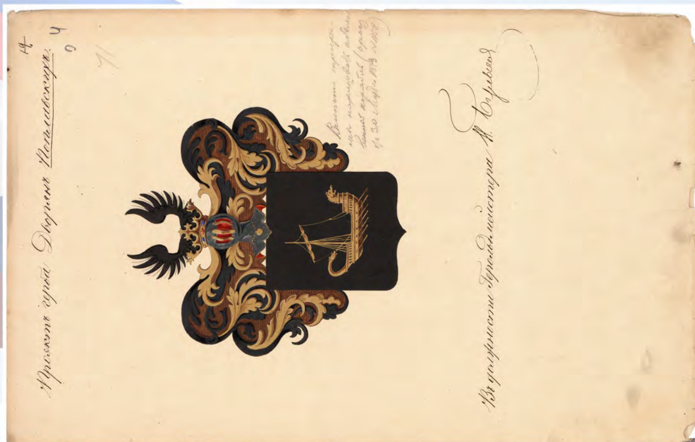
Рис. 2. РГИА. Ф. 1343. Оп. 49. Д. 1379. Л. 4. Публикуется впервые.