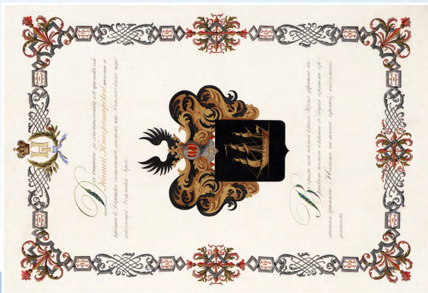
Рис. 6. РГИА. Ф. 1343. Оп. 49. Д. 1379. Л. 4. Публикуется впервые.