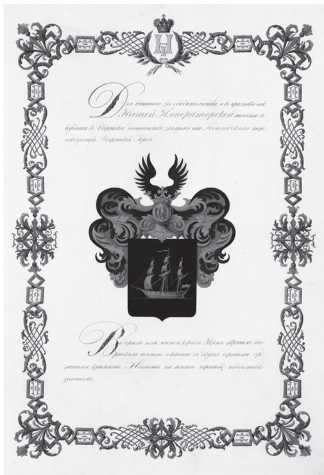
Рис. 5. Страница из диплома с гербом Поплавских.

роною с двумя черными орлиными крыльями. Намет на щите черный, подбитый золотом» (рис. 5; цветное изображение – рис. 6 на с. 77) 31 .