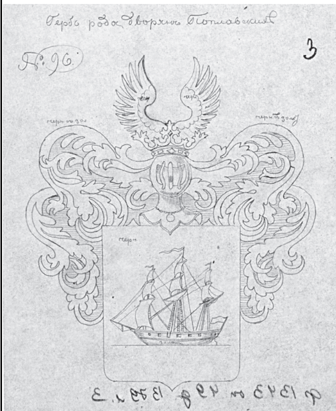
Рис. 3. Проект герба Поплавских, составленный в 1853 г. 28

утвержден 16 декабря 1855 г. – изображение их герба см. на рис. 4.