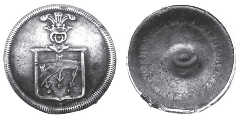
Рис. 1. Ливрейная пуговица с дворянским гербом, найденная в Гродненской области.

В июне 2021 г. в заброшенном парке бывшей усадьбы французского рода де Вирионов около д. Лишки Гродненской области была обнаружена металлическая ливрейная пуговица удовлетворительной сохранности (рис. 1).