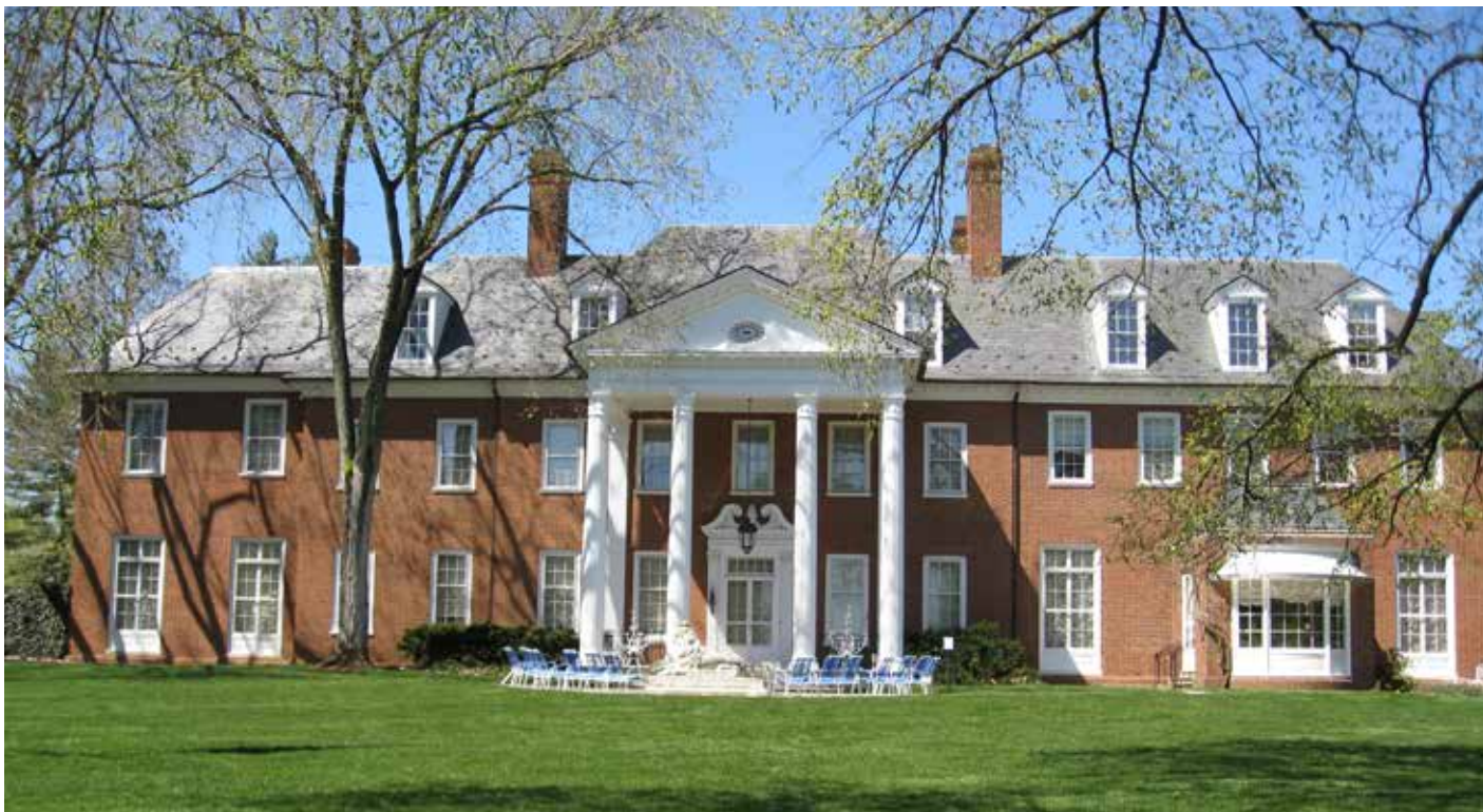
Основное здание музея Хиллвуд (Hillwood Estate, Museum & Gardens)