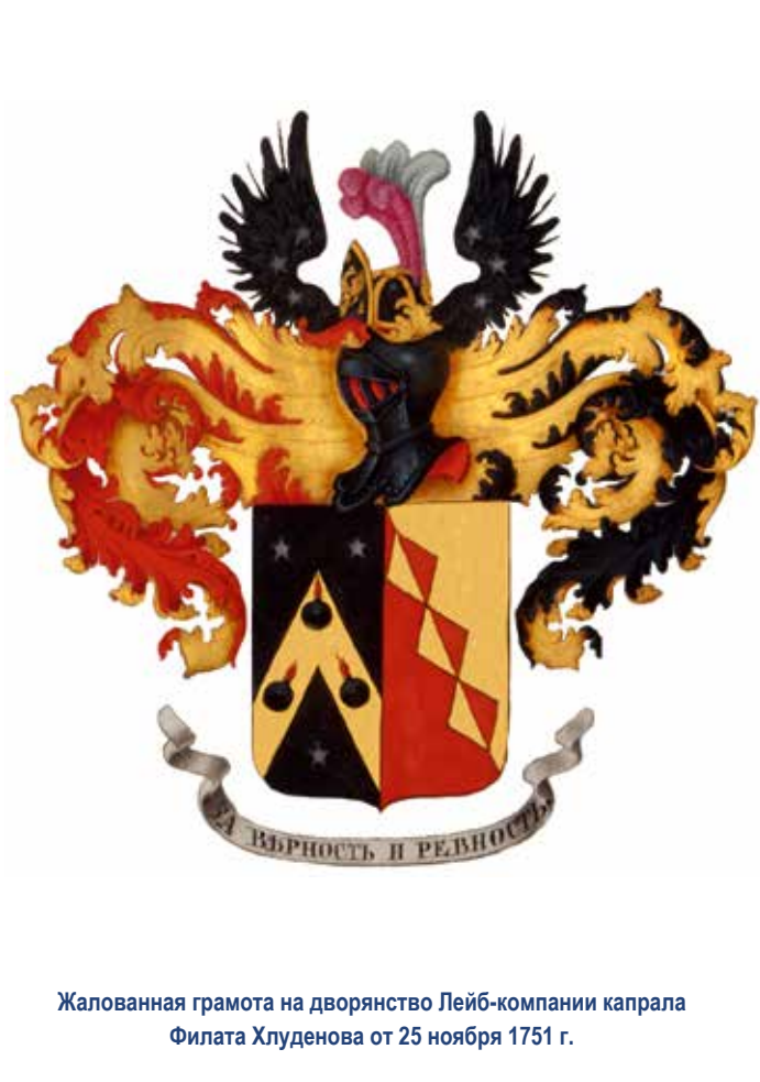
Жалованная грамота на дворянство Лейб-компания капрала Филата Хлуденова от 25 ноября 1751 г.