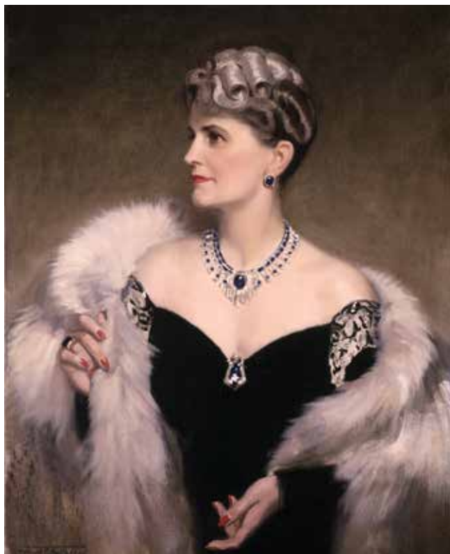
Портрет Марджори Мерриуэзер Пост ( Marjorie Merriweather Post ), 1946 г. Художник Фрэнк Оуэн Солсбери ( Frank Owen Salisbury )

Жалованная грамота даже не смогла вместить описание всех его заслуг, но сохранила блазон его уникального дворянского герба: «Щит разделен горизонтально на две части: в верхней в золотом поле, плывущий в правую сторону лебедь, с поднятыми крыльями и с дворянскою на голове Короною. В нижней части, разделенной золотою чертою надвое, в красных полях, в правом меч в ножнах, обернутый кожаную