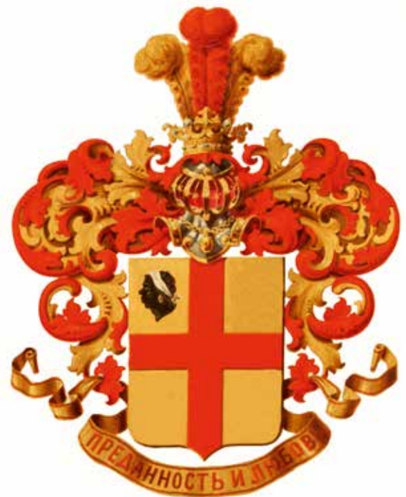
Жалованная грамота на дворянство титулярного советника Матвея Маврокордато от 21 февраля 1890 г.