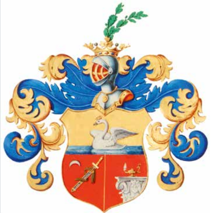
Жалованная грамота на дворянство коллежского секретаря Корсини от 5 февраля 1844 г.