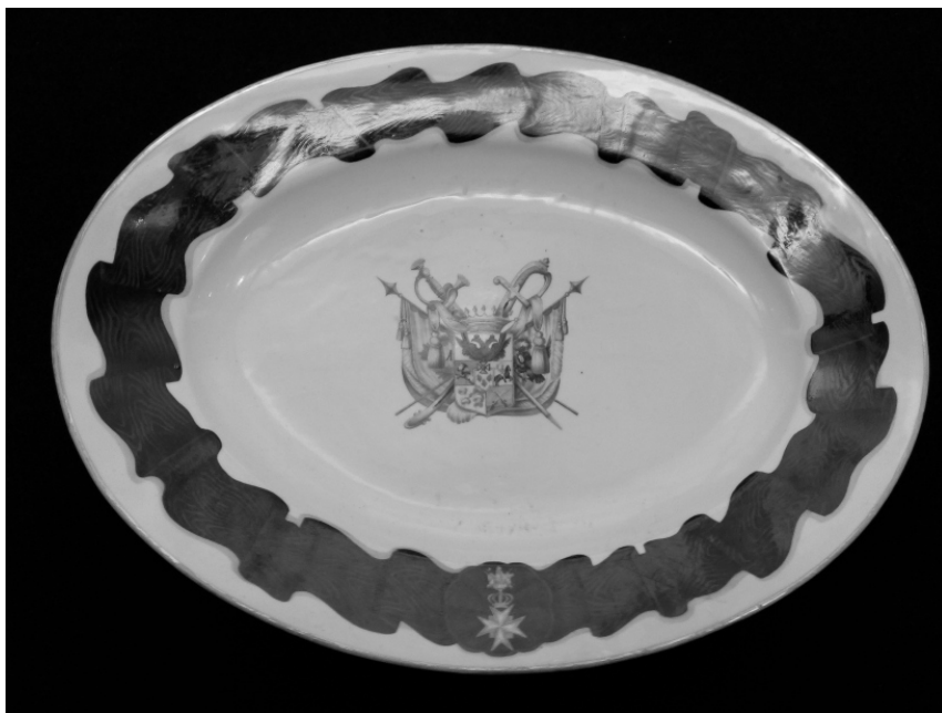
Ил. 1. Тарелка из парадного фамильного сервиза. 34,5 × 46,5 см. Инв. № П-600.

дер Палена в графы Всероссийской Империи, прибавлена золотая вершина (глава), в которой виден до половины вылетающий черный двуглавый коронованный орел, с изображением на груди в голубом поле вензелевого имени государя императора Павла Первого. Весь большой щит покрыт графской короной, на поверхности которой поставлены три серебряных шлема, увенчанные: средний – графской, а крайние два – баронскими коронами. На среднем шлеме видны четыре павлиньих пера и между ними три громовые стрелы. Над правым шлемом изображено Солнце, с двумя по сторонам его знаменами желтого и черного цветов. Над левым шлемом находится в щите означенный всадник на лошади с мечом. Намет на щите красный и зеленый, подложенный серебром и черным. Щит держат: с правой стороны воин в латах с малиновой перевязью, а с левой стороны – казак с пикой. Внизу щита девиз: «Constantia et zelo» 4 (ил. 2).