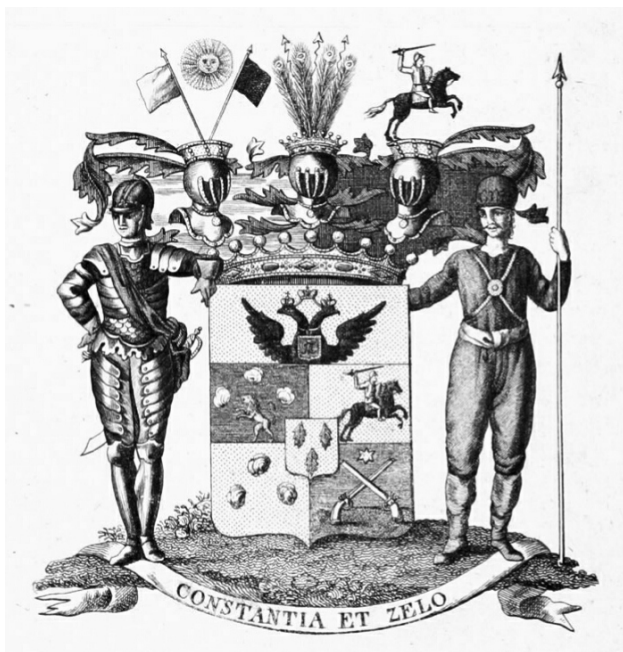
Ил. 2. Герб графов фон дер Пален. Из: Общий гербовник дворянских родов Всероссийской империи. СПб., 1794. Ч. 4. С. 10.