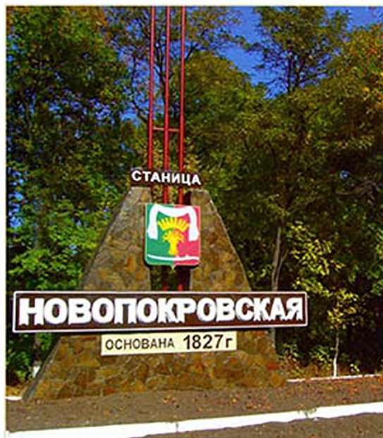
Герб Новопокровского муниципального района на стеле при въезде в станцию Новопокровскую; гербы Новокубанского городского поселения на стеле при въезде в г. Новокубанск