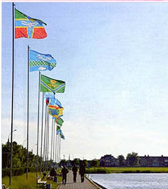
Флаги муниципальных образований Славянского района на набережной г. Славянска-на-Кубани; герб Ейского городского поселения на стеле при въезде в г. Ейск